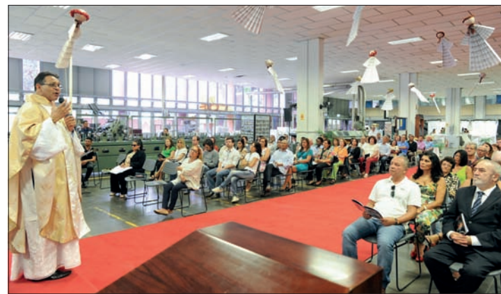
Servidores assistem à missa de aniversário em ambiente decorado na Gráfica

Os aposentados foram homenageados e presenteados com um certificado de gratidão pelos serviços prestados.