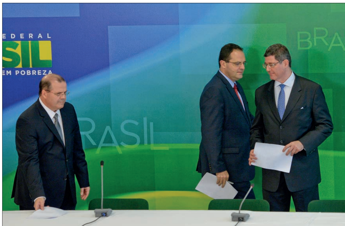
Alexandre Tombini, Nelson Barbosa e Joaquim Levy em entrevista coletiva no Palácio do Planalto após o anúncio

Aliados do governo elogiaram os nomes anunciados para os Ministérios da Fazenda e do Planejamento, além da continuidade no Banco Central. A oposição apontou incongruência com o discurso de campanha