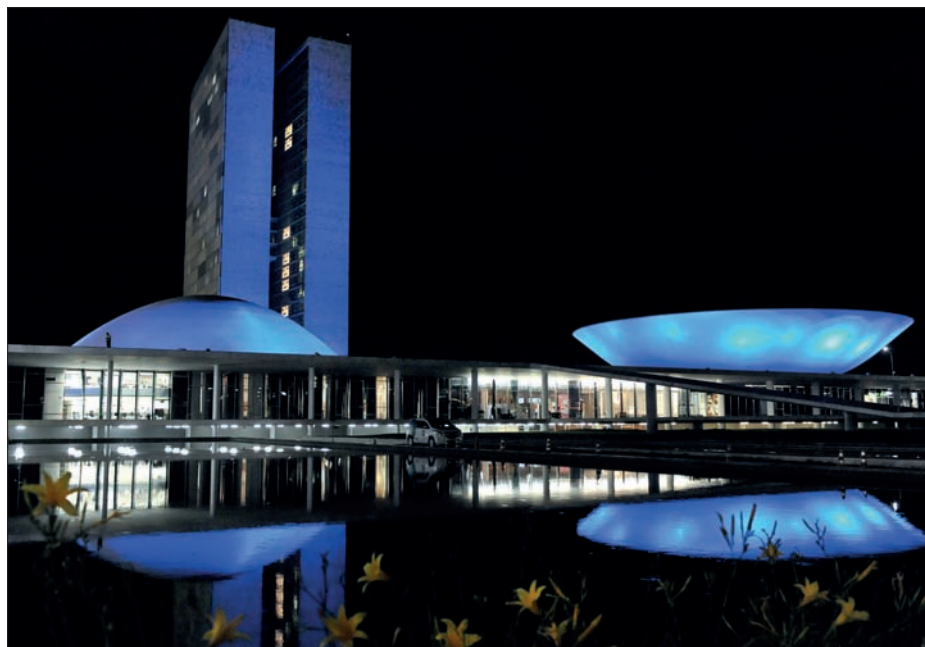
Congresso aprovou o projeto mês passado e, com iluminação especial, participa do Novembro Azul

Dados do Instituto Nacional do Câncer (Inca) indicam que, no Brasil,