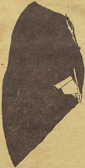
A rabona delle, attribuida a Sebastião Soares de Maia, vulgo Pitão Tesoura Firme, de Macambomba.

Já estavam escriptas as linhas acima, quando recebemos a carta que em seguida publicamos: