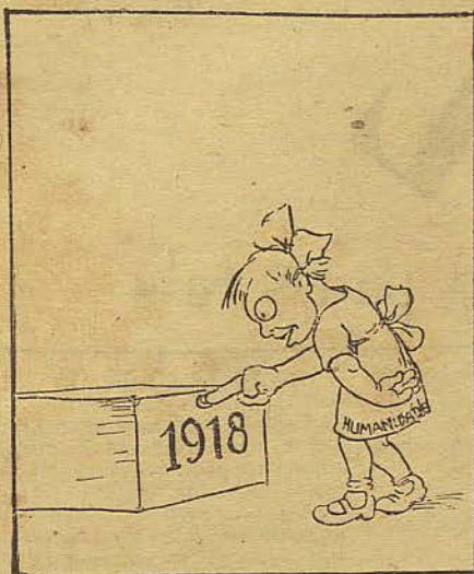
Que conterá elle?