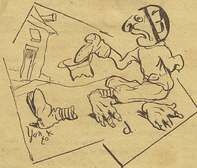
Uma esmolinha por amor de Deus a um pobre typo victima de um pastel.

(.) Precisa-se de um annuncio pago, para este parenthesis. Propostas ao Pastel, aqui mesmo.