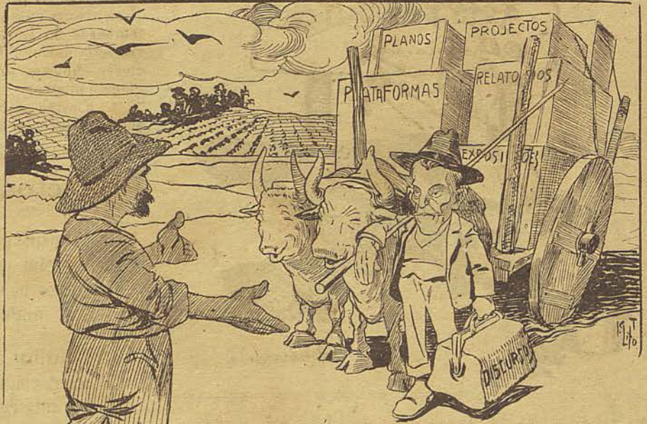
O FAZENDEIRO — E as sementes, seu doutô?

Todas as mães gostam de vestir bem os seus filhinhos.