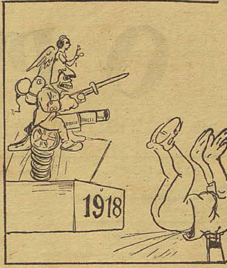
... ou a guerra?!...