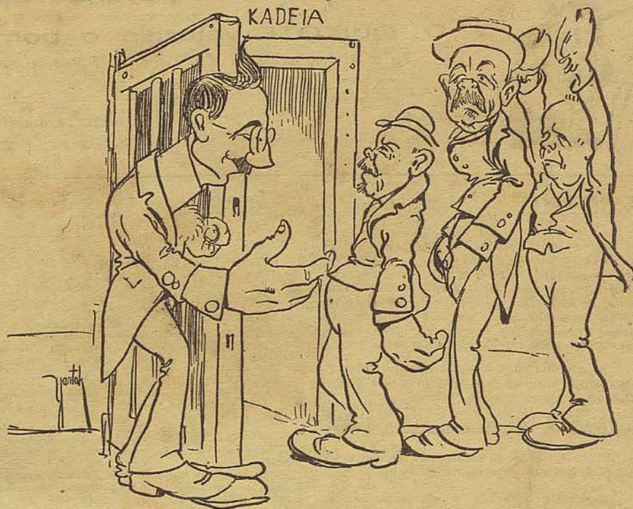
O Chefe — Não era grade de xadrez que vocês queriam? Pois não façam cerimonia.

A Casa Arp foi assaltada por pretender collocar grades de ferro nas portas.