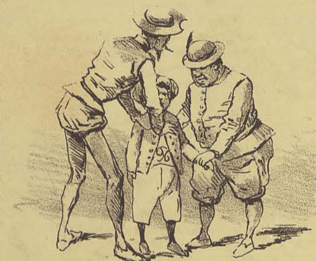
O pobre 96 voltou a si e tambem voltou-lhe a vontade de...