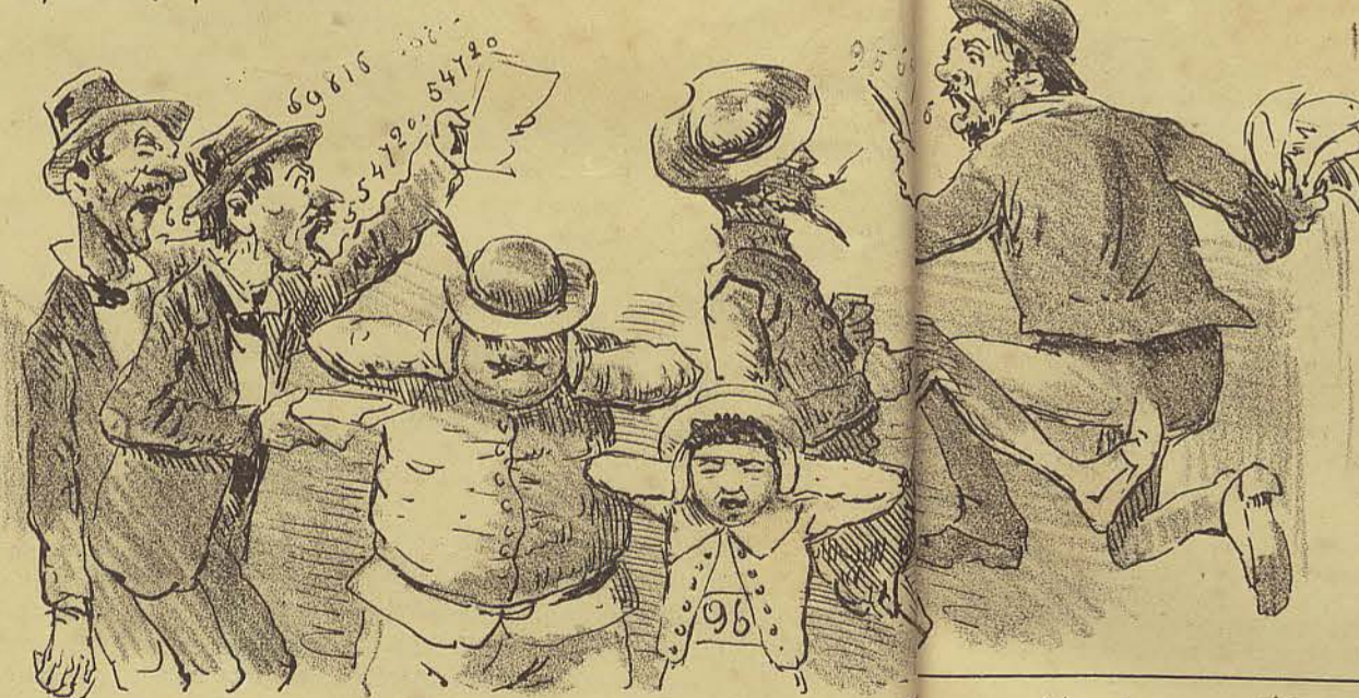
Passando pela rua do Ouvidor, a gritaria, mais infernal ainda do que loterica, vendam seus biles mas não amolera!