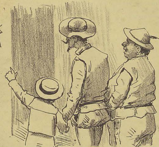
96 - Será esta casa algum museu Zoologico? Só ouco fallar em camello, onça, gato, porco... D.Q - É o fogo dos bichos, hoje o principal negocio desta Capital.