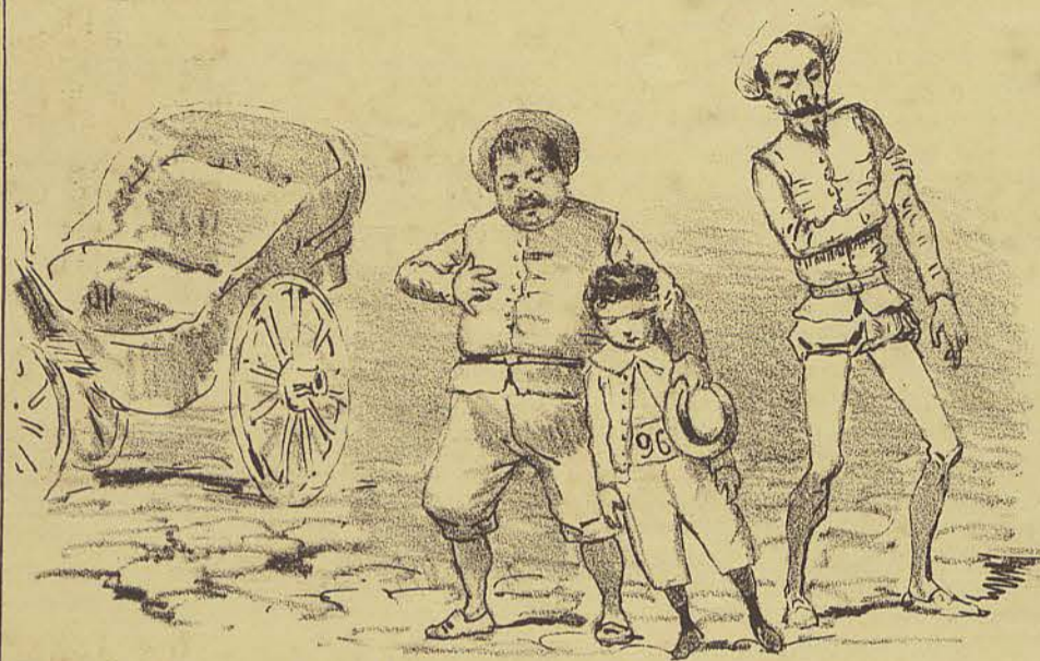
O carro, afinal, parou e delle apertamos-nos n'um estado deploravel! Andar de carro com tal calçamento... nunca mais!