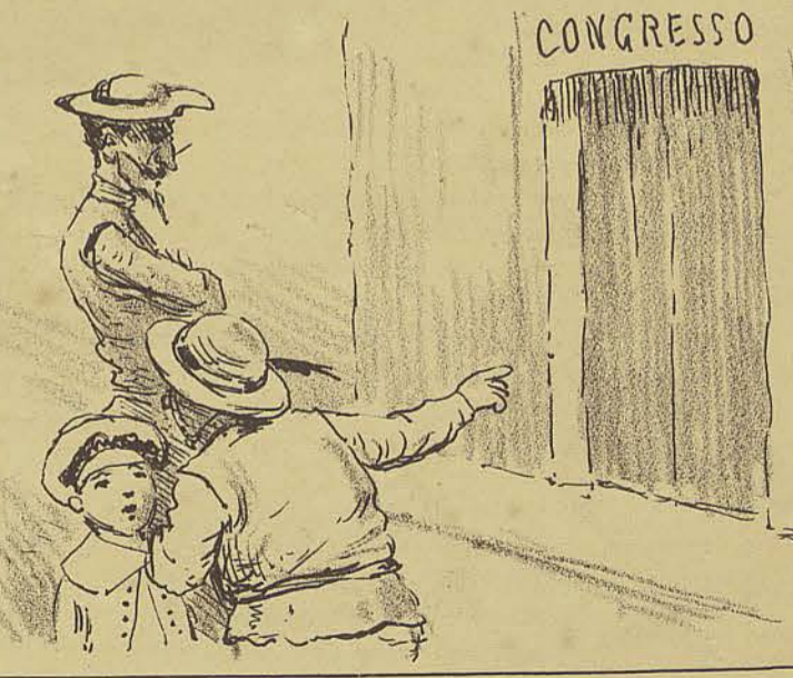
96 - E aquella casa fechada? S.P - Tambem alli ha bichos e ferozes, que jogam contra a tranquillidade da Republica. (Continua.)