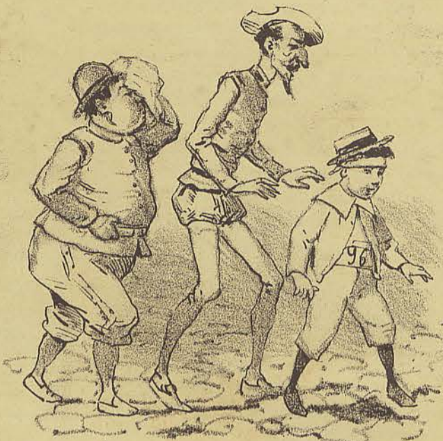
Apesar de horrivemente contusos, proseguimos o nosso caminho, mas desta vez a pé. 96 - Hei-de acostumar-me. Que remedio!