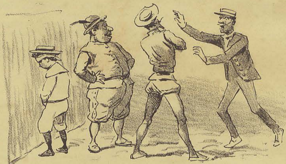
Tatámos de fazer com que 96 desse expansão a uma necessidade tão justa quanto natural. Um fiscal oppõe-se. D.Q - Então elle hade fazer pipi nas calças?