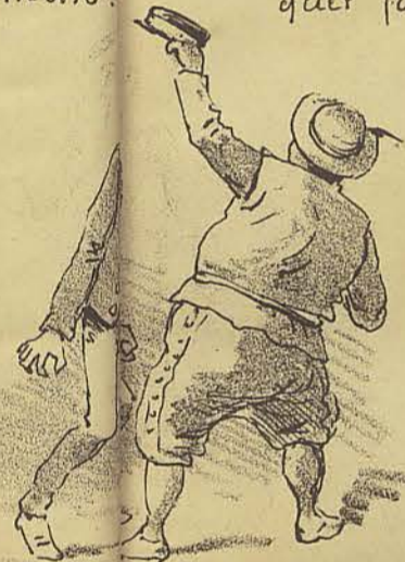
S.P - ha um meio... este.