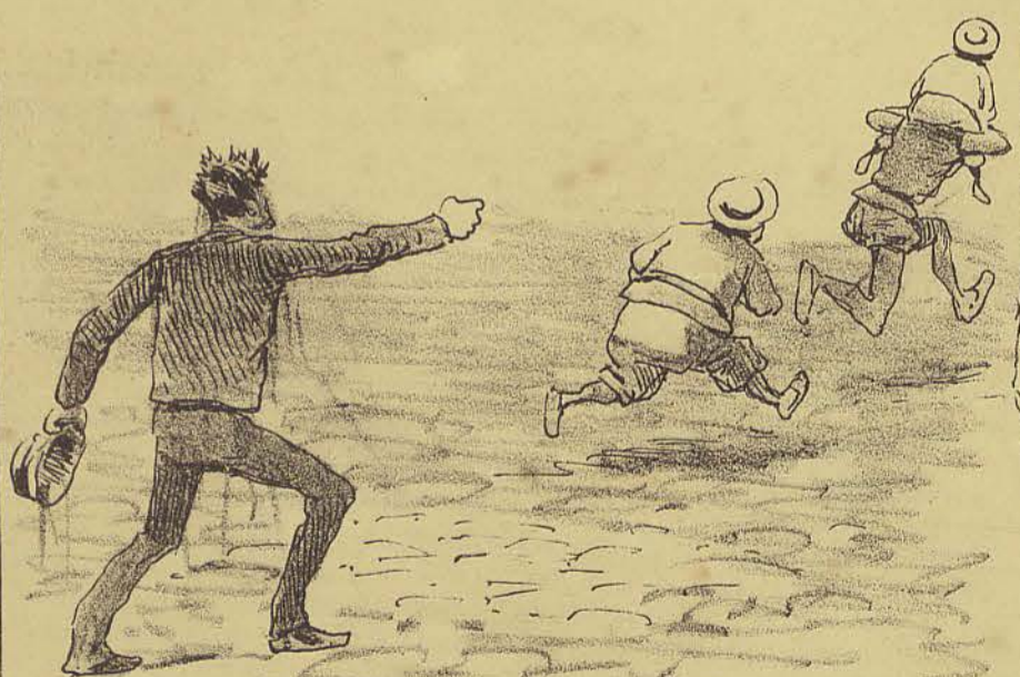
E sem mais aquella, puxeram-se todos tres ao fresco