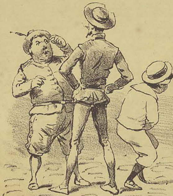
D.Q - Como hade ser, Sancho? Conheco bem a cidade, mas muito pouco os mictorios. S.P - Homem! Ouvi dizer que na rua Direita.