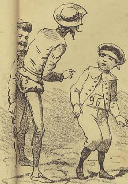
Desculpe-me Sr D. Queixote, ... Estou com vontade de... Q - De que? P - Ora está visto... O menino quer fazer pipi!