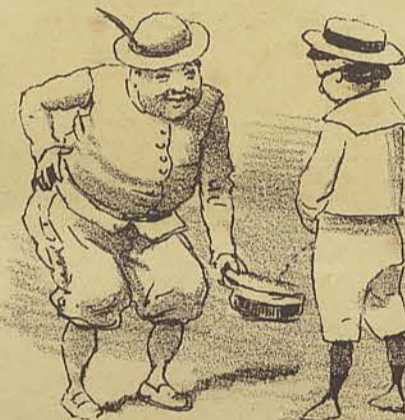
S.P - Que tal o mictorio? 96 - Na falta d'outro...