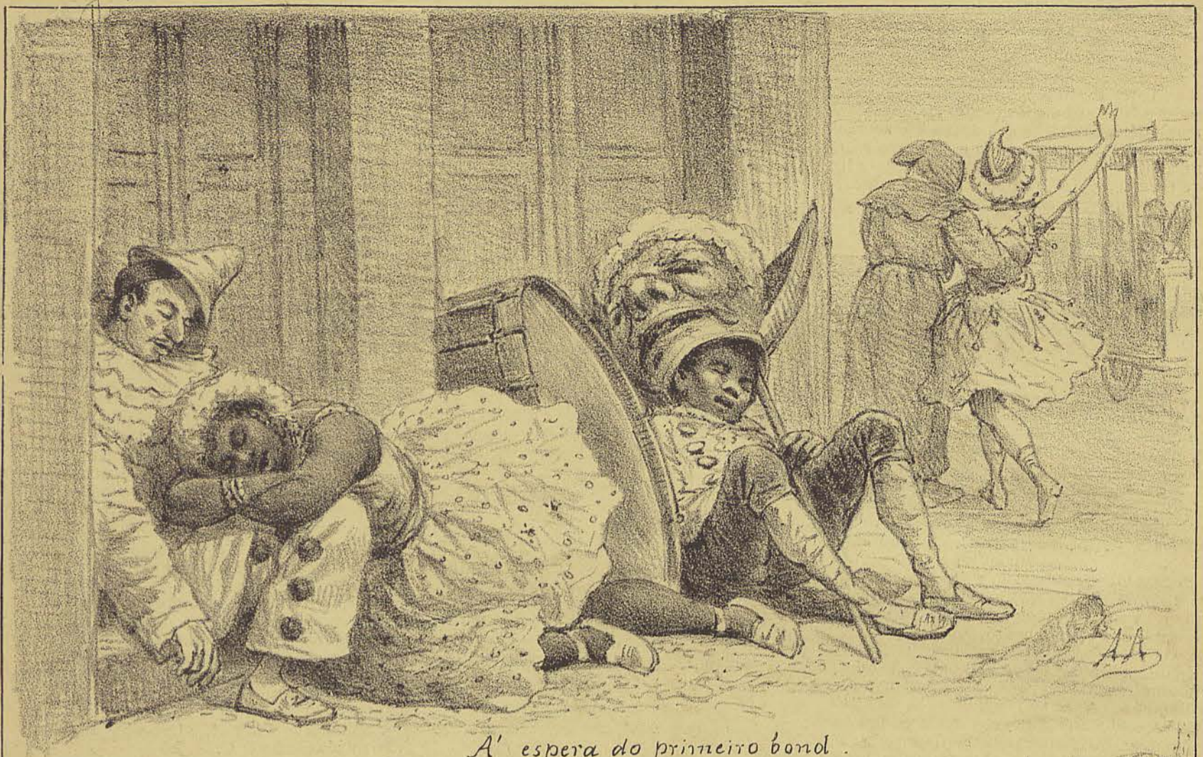
A' espera do primeiro bond.