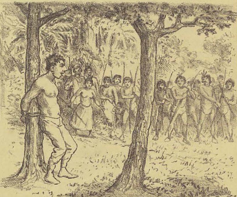
Em seguida ataram o infeliz a uma arvore e dispuzeram-se a crival-o de flechas.