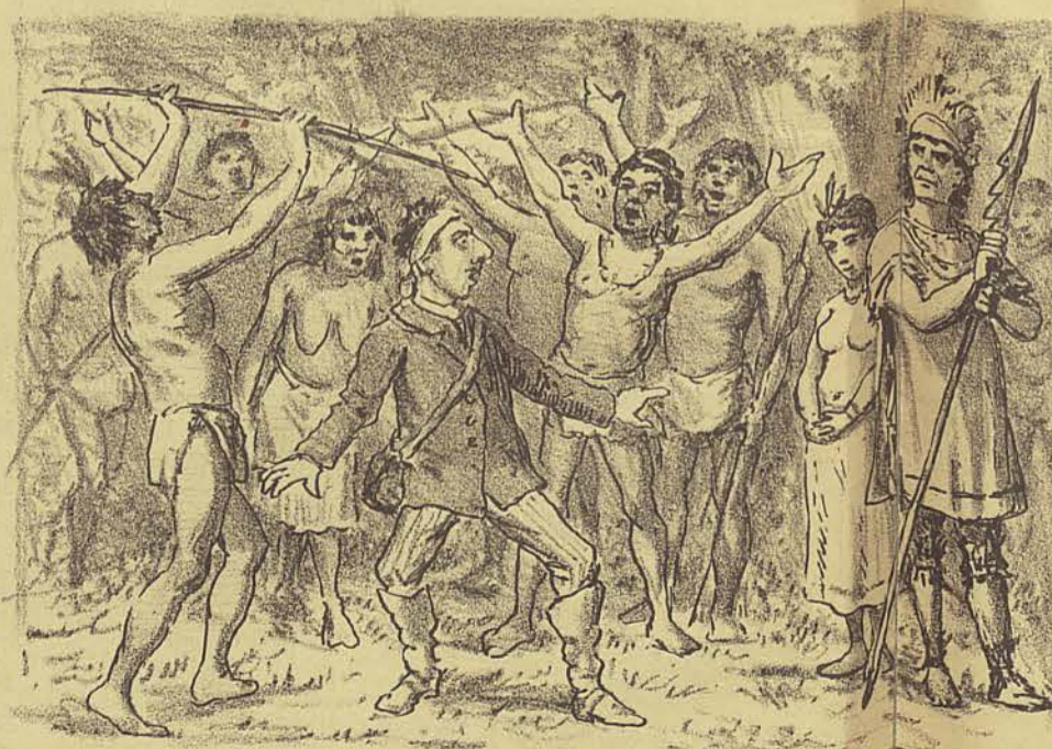
ouve uma infernal cozeria estrugir por todos os lados. O cacique acabava de condemnar o prisioneiro á morte! E os indios... maldados! regosijavam-se todos.