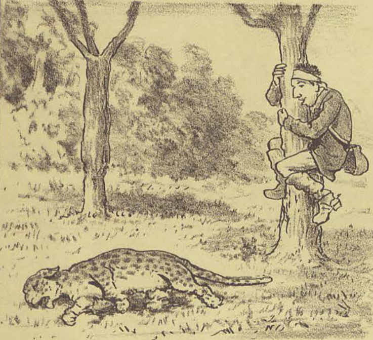
Cahindo de grande altura, a fera chegou ao chão, atordoadá pelo baque e com duas patas quebradas.