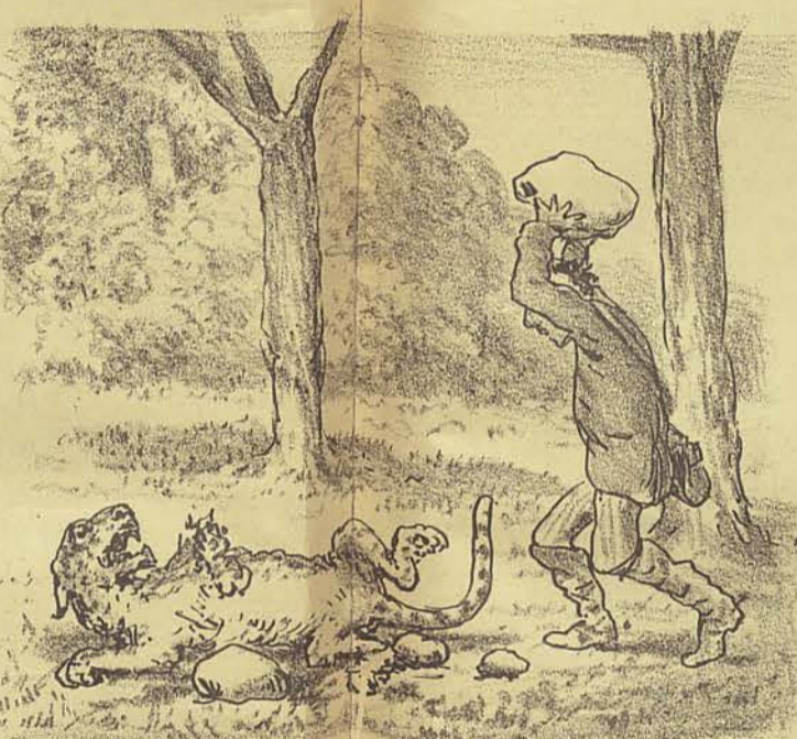
Depois de observar que o seu implacavel inimigo tinha duas patas quebradas e que o impedia de se mecher, Zé resolveu ringar-se do susto que lhe pregara, matando-a a pedradas.