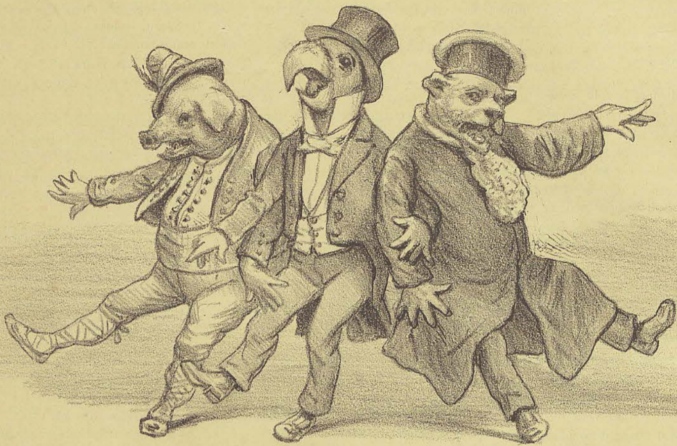
Os tres Jacarés Municipal, Legislativo e Judiciario.