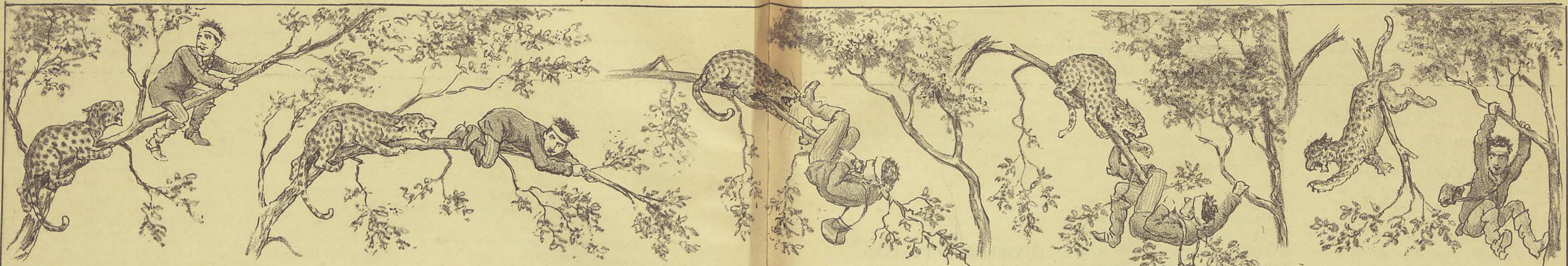
O pobre Zé, apesar de julgar-se perdido, não estava disposto a deixar-se apanhar sem tentar um ultimo esforço. Tratou, pois, de ir sempre trepando.