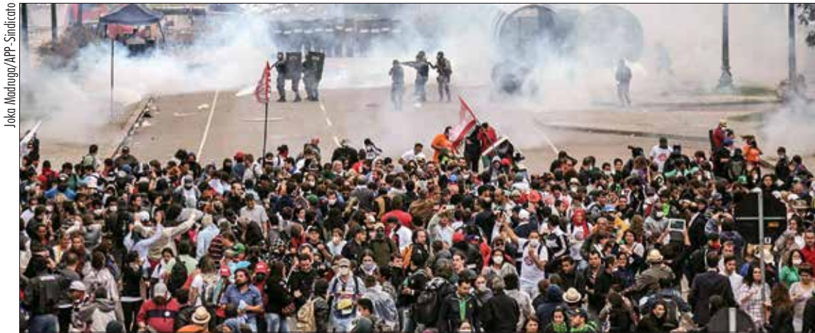
Policiais entram em confronto com manifestantes que protestavam contra projeto que altera a previdência estadual

Senadores marcaram audiência pública para quarta-feira, com o objetivo de debater os excessos da ação policial no estado, que deixou cerca de 200 pessoas feridas. Governador Beto Richa é um dos convidados