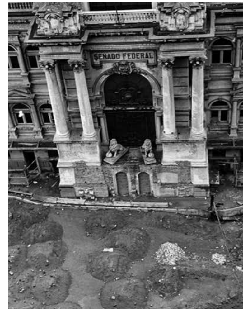
O Palácio Monroe perto de ser derrubado, já sem a imponente escadaria

A notícia repercutiu em Brasília, especialmente entre os