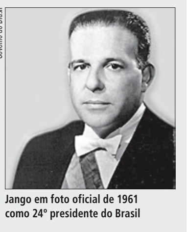
Jango em foto oficial de 1961 como 24º presidente do Brasil