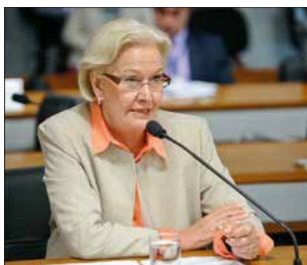
Senadora Ana Amélia defende que médicos estrangeiros passem por exame do MEC

Também estava pronto para ser votado um projeto de Vanessa Grazziotin (PCdoB-AM) que previa um grupo parlamentar entre Brasil e Indonésia, mas a pedido da própria senadora e de outros