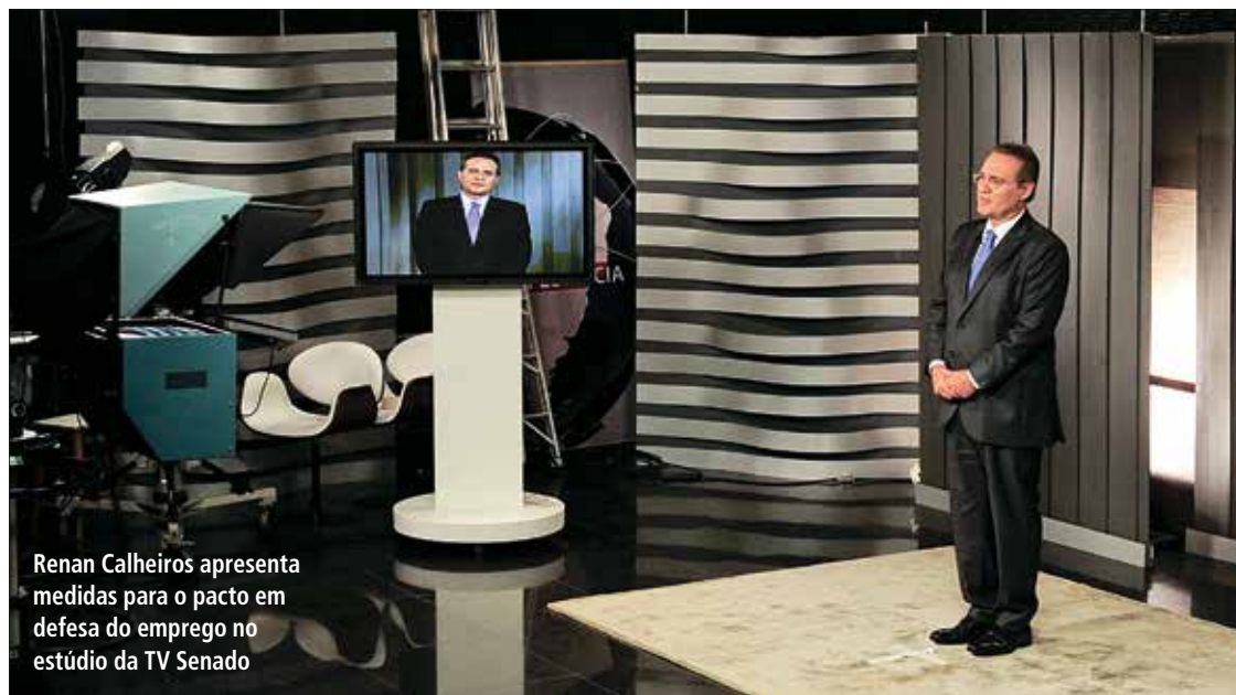
Renan Calheiros apresenta medidas para o pacto em defesa do emprego no estúdio da TV Senado

trabalho e a fixação de meta de emprego, a serem perseguidas assim como já acontece com as metas fiscal e de inflação. As sugestões de Renan deverão ser debatidas em sessão temática sobre crise e desenvolvimento na quarta-feira. O Dia do Trabalho foi tema de vários discursos em Plenário. 4 e 5