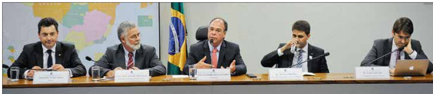
Senador Fernando Bezerra Coelho (C), que preside a comissão, diz que o acordo do clima também deve estar na pauta do encontro entre Dilma e Obama

Para o subsecretário-geral de Meio Ambiente do Ministério de Relações Exteriores, embaixador José Antonio Carvalho, este é o momento de definir as “regras do jogo”. Ele defende que o novo acordo aponte as necessidades de cada país e avalia que nenhuma