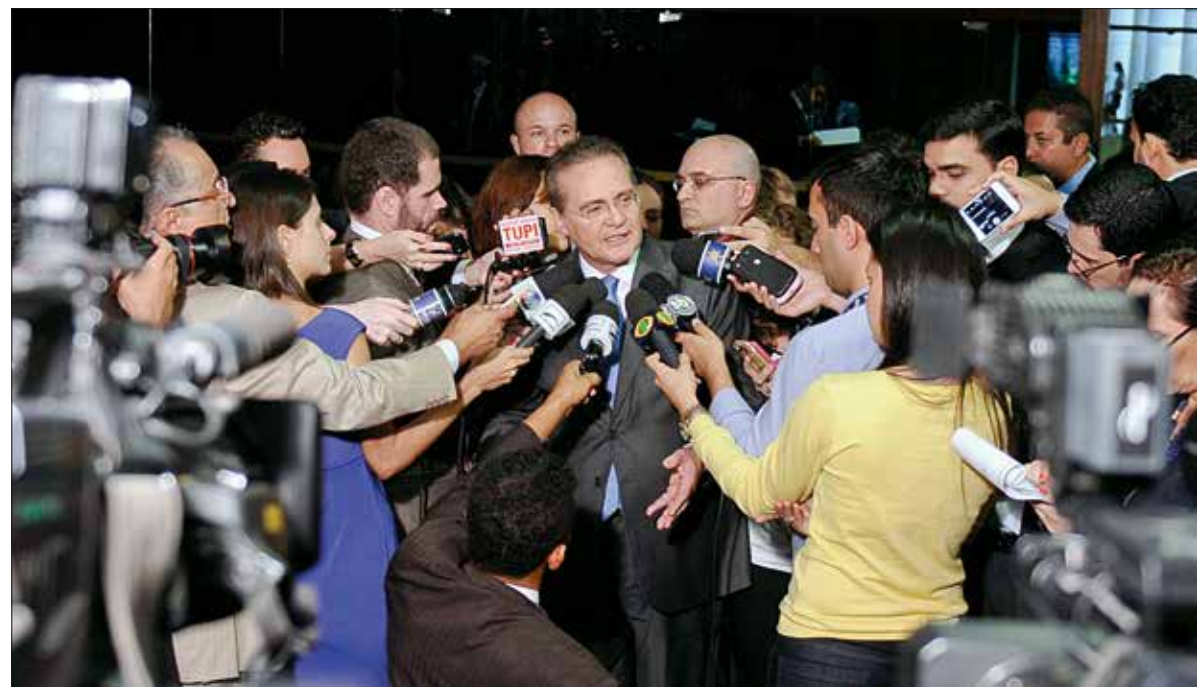
Renan disse esperar que Dilma compre a ideia do pacto para romper com o que ele chamou de falta de iniciativa diante da crise

Apesar de não se traduzir de imediato em proposição legislativa, o pacto lança iniciativas que compõem uma pauta positiva em favor da recuperação dos índices de emprego, tendo como objetivo o reaquecimento da economia. Entre elas, está a manutenção de parte da desoneração da folha de pagamentos