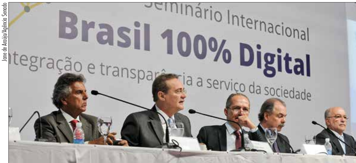
Renan Calheiros (2º à esq.) anunciou implementação do sistema em seminário promovido pelo TCU e pelo Executivo

Estima-se economia anual de cerca de R$ 1,3 milhão com a implantação do novo sistema digital de tramitação de documentos, que elimina o uso de papel na administração da Casa e reduz burocracia