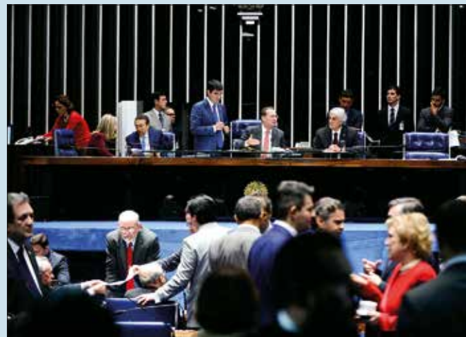
Plenário do Senado na sessão que aprovou projeto de Lei da Mediação