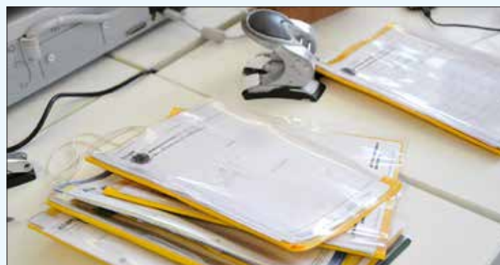
Sem versão impressa, processos podem ser consultados simultaneamente

Apesar do possível estranhamento provocado pela mudança, a fase de adaptação transcorreu sem grandes problemas. De acordo com Ilana, as dificuldades são inevitáveis, já que se trata de