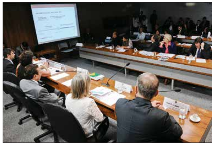
Audiência pública no Senado sobre psoríase: doença afeta pele e não tem cura