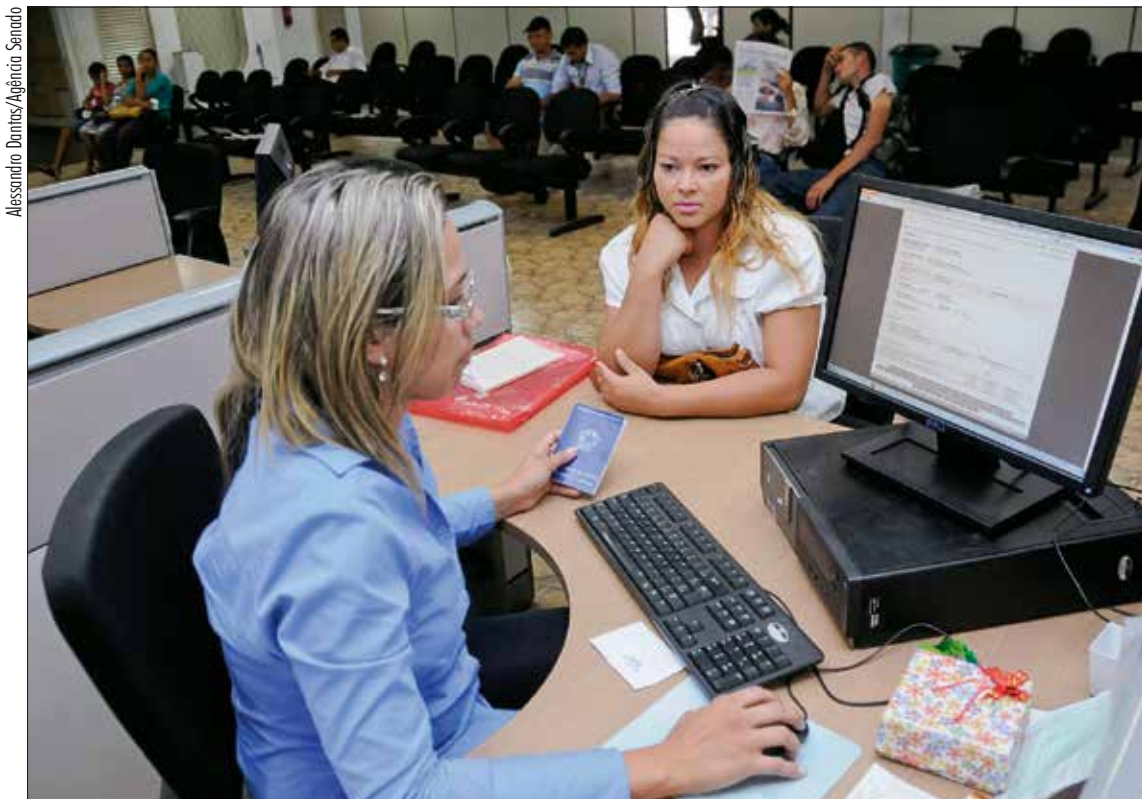
Agência pública do trabalhador em setor de Brasília: aumento do desemprego e trabalho informal preocupam parlamentares

Formação do grupo, que contará com senadores e deputados, foi sugerida em projeto de Paulo Paim aprovado pelo Senado na quarta. Objetivo é debater soluções contra o desemprego, que chegou a 8%