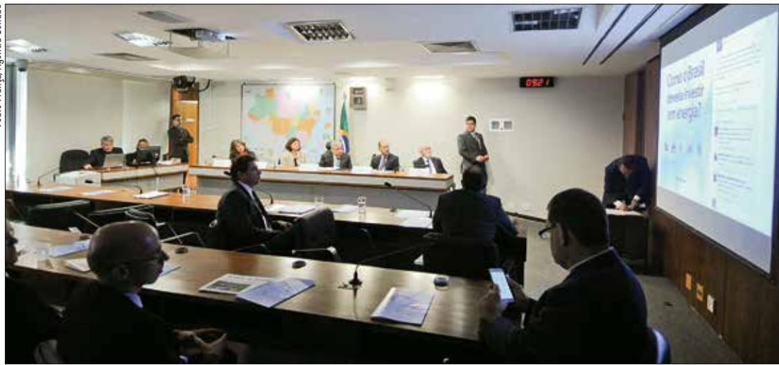
Senador Garibaldi Alves Filho (C) conduz o lançamento da 25ª edição da revista do Senado na Comissão de Infraestrutura