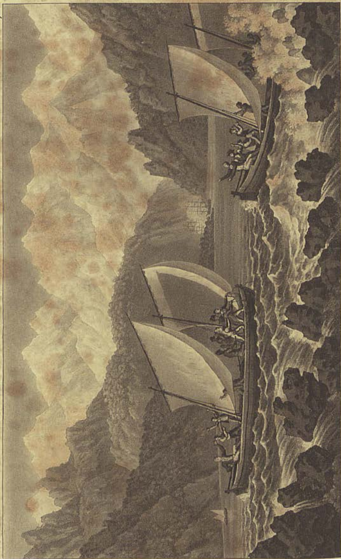
Naufrage des canots de la Pérouse.