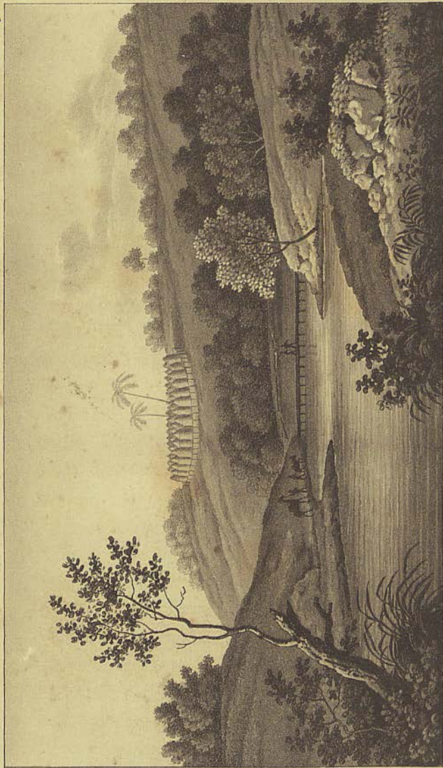
Village negre pres de la Gambie