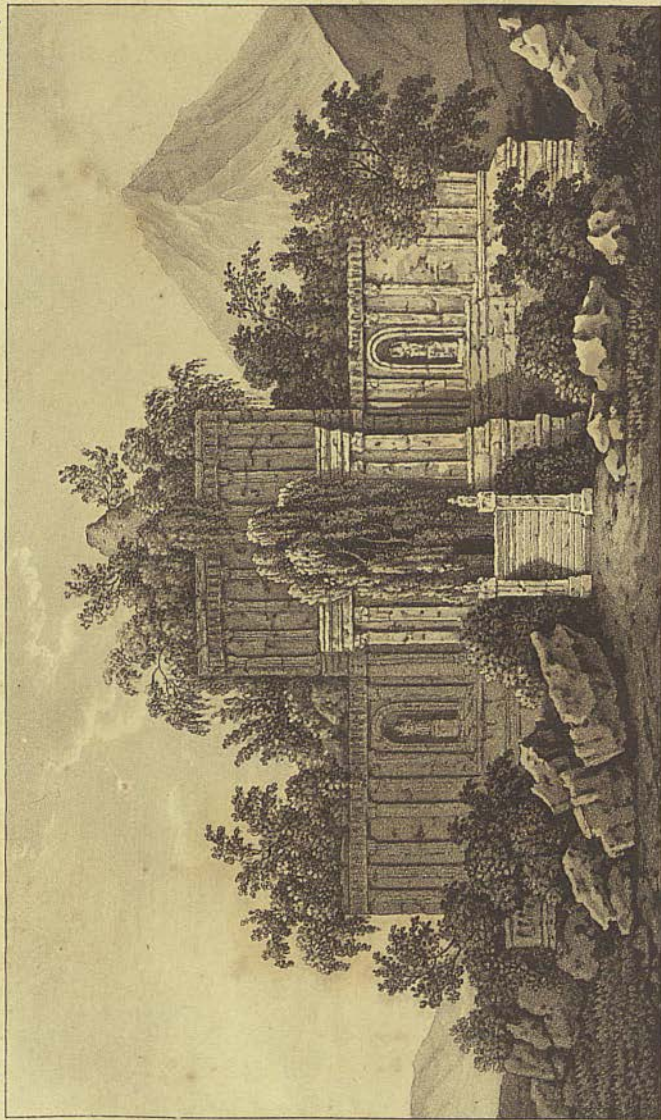
Ruines d'un temple dans l'île de Savao.