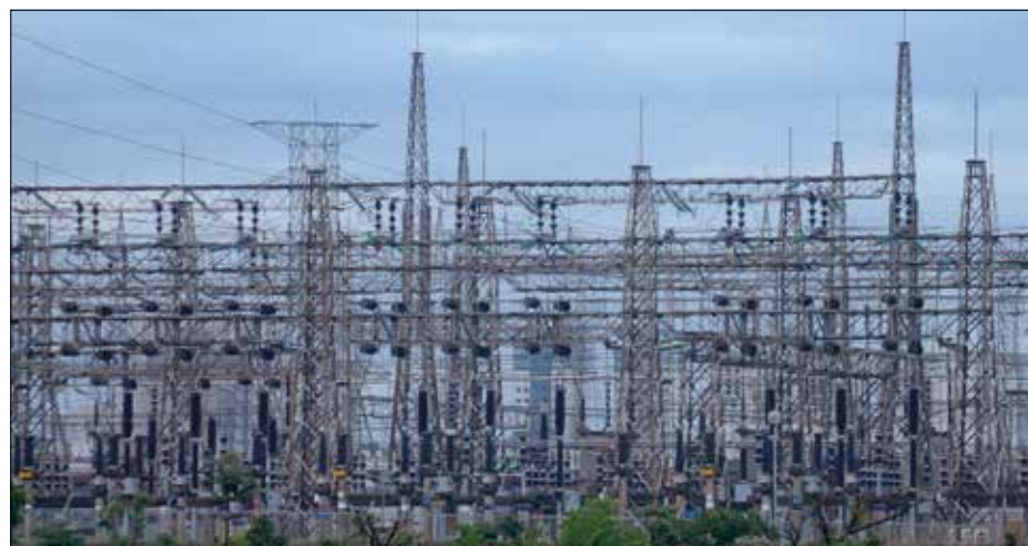
MP estabelece prazo de até 210 dias para distribuidoras de energia assinarem contrato ou aditivo

ao Ministério de Minas e Energia, recomendando a prorrogação das outorgas. “Ocorre que se faz necessário maior prazo para a conclusão dos estudos por parte dos concessionários interessados”, diz a justificativa. O governo ressalta que a maioria dos concessionários já assinou os contratos ou aditivos.