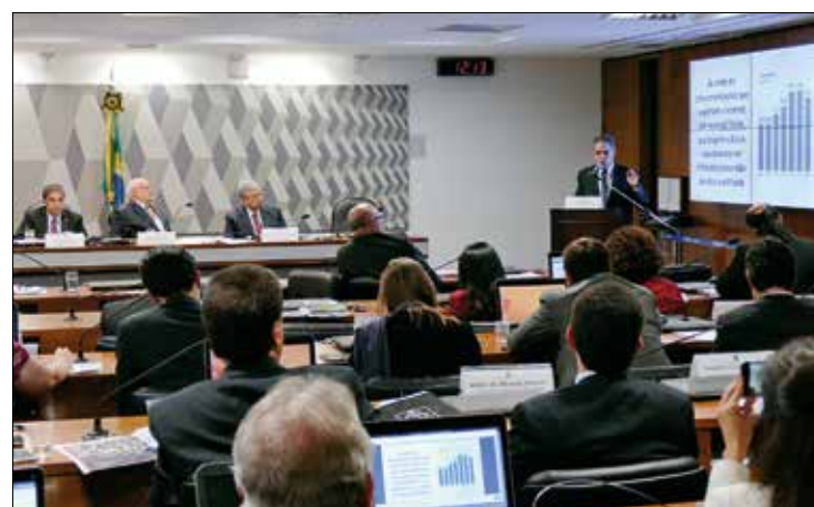
Representante das empresas de telefonia fala na audiência conjunta do Senado

Orçamentárias para o próximo ano. Também está pendente de avaliação pelo colegiado medida provisória que abre crédito de R$ 180 milhões para a Presidência da República e o Ministério do Esporte. 2