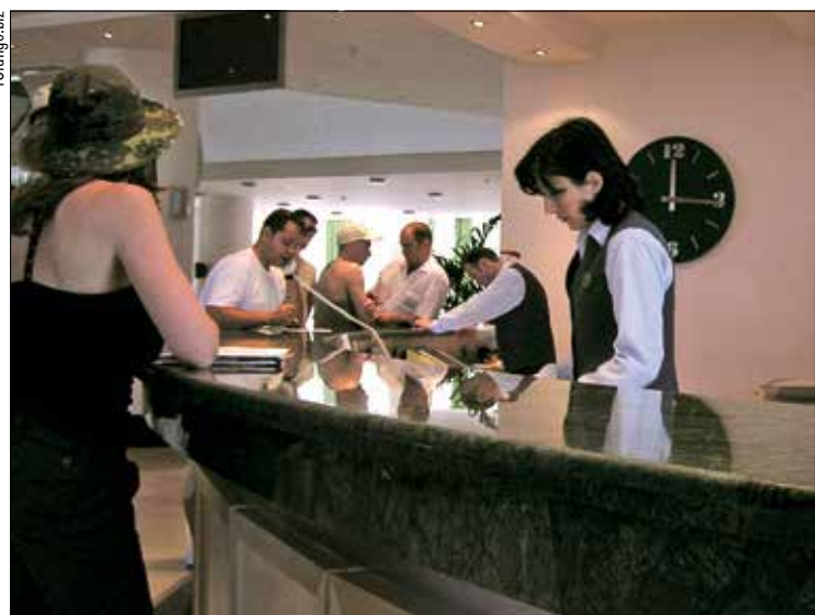
Proposta atende setor hoteleiro, que tem demanda variável de mão de obra

Com a alteração, Rocha espera atender melhor a pré-Amazônia mato-grossense e maranhense, com a oferta ao setor produtivo de linhas de financiamento mais identificadas com os processos de produção da Região Norte. A inclusão das novas áreas ocorreria sem prejuízo da atual ação do Fundo Constitucional de Financiamento do Centro-Oeste (FCO) e do Fundo Constitucional de Financiamento do Nordeste (FNE).