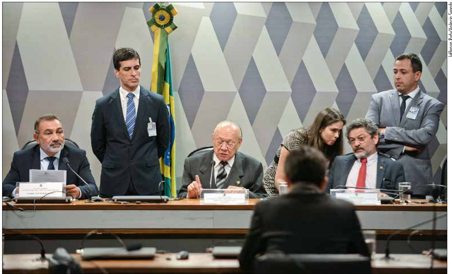
Telmário Mota, relator do processo, João Alberto Souza, presidente do Conselho de Ética, e Paulo Rocha, vice-presidente, na votação sobre mandato de Delcídio

Delcídio não compareceu à reunião do Conselho de Ética para apresentar defesa.