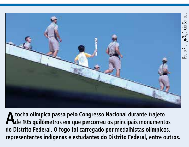
A tocha olímpica passa pelo Congresso Nacional durante trajeto de 105 quilômetros em que percorreu os principais monumentos do Distrito Federal. O fogo foi carregado por medalhistas olímpicos, representantes indígenas e estudantes do Distrito Federal, entre outros.

Com os novos membros, a comissão deve voltar as atenções para a análise do projeto da Lei de Diretrizes Orçamentárias de 2017. A Comissão Mista de Orçamento também analisa as medidas provisórias que tratam da abertura de créditos extraordinários. Uma delas, a Medida Provisória 722/2016, que abre crédito de R$ 180 milhões para a Presidência da República e para o Ministério do Esporte, aguarda análise do colegiado.