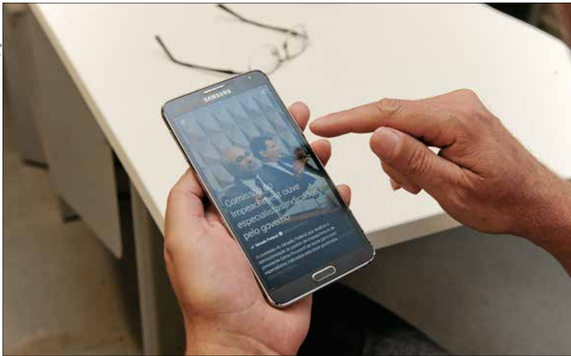
A ideia é que os usuários possam acompanhar com mais facilidade e em tempo real o debate político travado na Casa