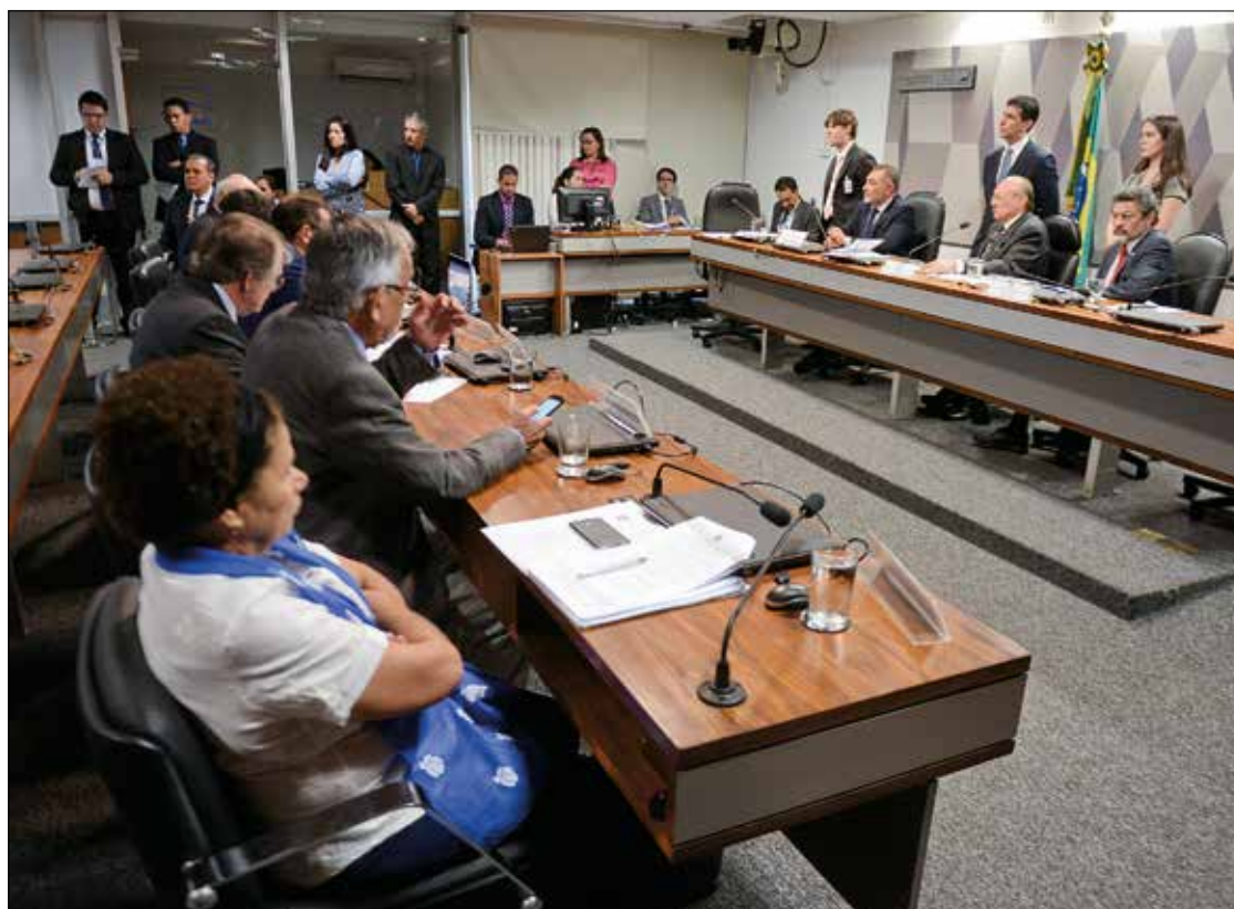
Telmário Mota, João Alberto Souza e Paulo Rocha compuseram a mesa na sessão do Conselho de Ética que aprovou processo

parlamentar. A prova da conversa é uma gravação em que Delcídio oferece a Bernardo Cerveró ajuda para que seu pai, Nestor Cerveró, ex-diretor da Petrobras, saia do país sem fechar acordo de delação premiada na Operação Lava Jato. Delcídio não compareceu à reunião e seus advogados propuseram apenas perda temporária do mandato, alegando que não houve enriquecimento ilícito. Disseram ainda que vão recorrer ao Supremo, pois consideram a gravação uma prova ilegal. 3