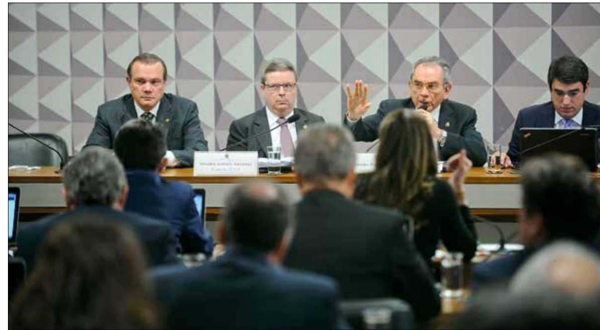
O presidente da comissão, Raimundo Lira, fala em reunião, ao lado de Wellington Fagundes (E) e Antonio Anastasia (2ª à esq.)

O professor recomendou cautela com “a sedução da decisão que parece acalantar o espírito das pessoas” e citou o filósofo alemão Martin Heidegger, que disse que tinha que acompanhar