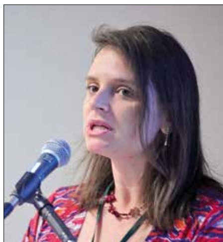
Pedro França/Agência Senado