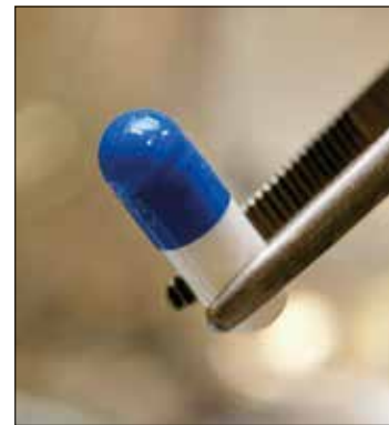
Cápsulas de fosfoetanolamina produzidas em São Carlos (SP)

O texto também estabelece que, em caso de descumprimento injustificado das metas e obrigações pactuadas pela agência por dois anos consecutivos, os membros da diretoria colegiada serão exonerados mediante solicitação do ministro da Saúde. A