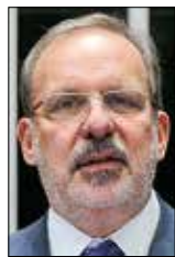
Armando Monteiro/Agência Senado

Ele disse que trabalhou nessa agenda como ministro do Desenvolvimento e ressaltou acordo assinado com o governo dos Estados Unidos sobre a questão.