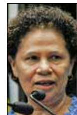
Jane de Araújo/Agência Senado

— Não vou deixar barato. O que vier dessa ação será dedicado às mulheres que servem cafezinho — disse.