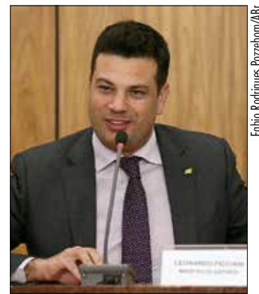
Picciani aguarda votação de MP importante para Jogos Olímpicos

A proposta harmoniza a legislação brasileira com o Código Mundial Antidopagem. Também cria a Justiça Desportiva Antidopagem e