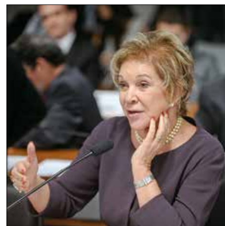
Substitutivo de Marta incluiu as companheiras de relação homoafetiva entre as beneficiadas

O texto de Aécio não previa a concessão dos benefícios à companheira de relação homoafetiva, lacuna que foi preenchida no substitutivo de Marta.