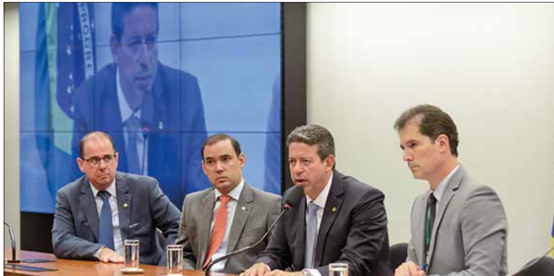
Na presidência, deputado Artur Lira conduz reunião da Comissão de Orçamento que definiu relator da nova meta fiscal

O presidente da CMO informou que está costurando