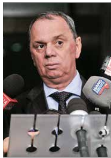
Presidente do órgão, Cançado anuncia proposta de parceria com a Unesco

O presidente do Conselho de Comunicação disse que pretende discutir na próxima reunião do colegiado, prevista para 6 de junho, a limitação da internet e o bloqueio do aplicativo WhatsApp. Segundo ele, esses são assuntos que incomodam todos os integrantes do conselho, já que é um órgão de interlocução da sociedade civil com o Parlamento.