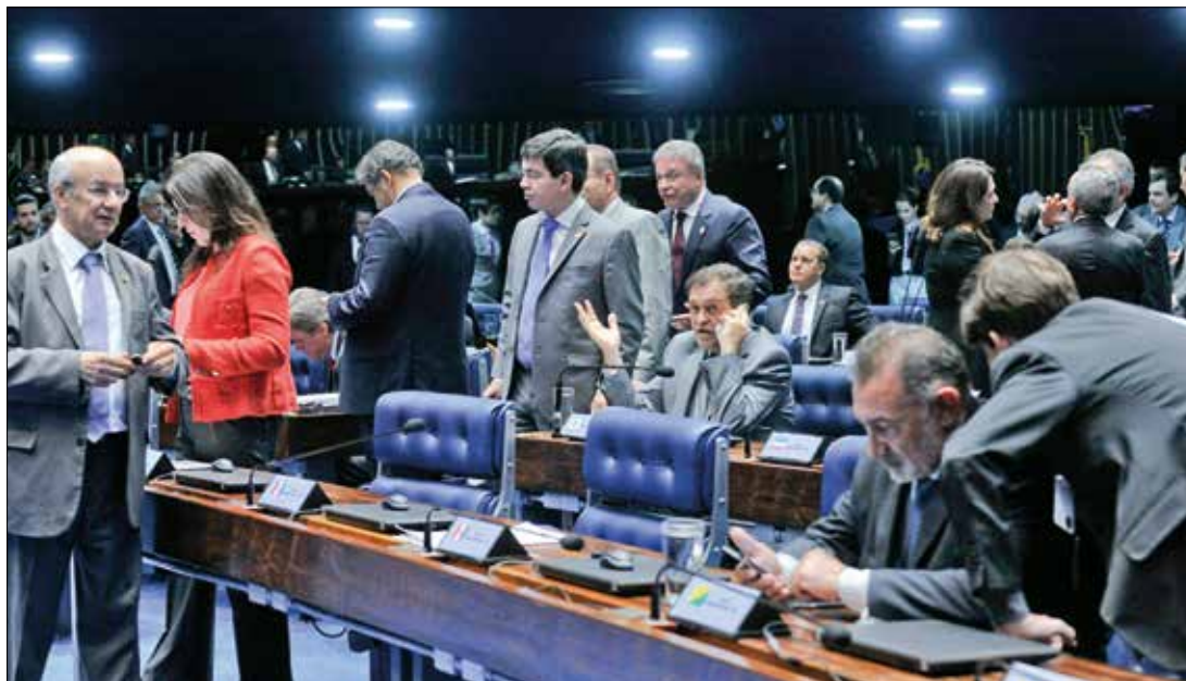
Jane de Araújo/Agência Senado

Avança projeto que beneficia agências de turismo 4