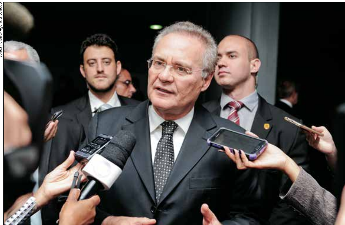
Segundo Renan, Michel Temer ficou de refletir sobre proposta de recriar a pasta, uma das 9 extintas pelo novo governo

— Essa mudança pode ser feita no Congresso Nacional e eu me comprometo a conduzir o processo, como presidente do Congresso.