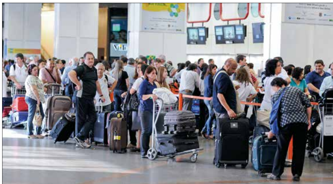
Venda de pacotes compostos de passagem aérea e hospedagem é um dos serviços que podem ter cobrança padronizada

Para Rollemberg, a diferença de procedimentos observada