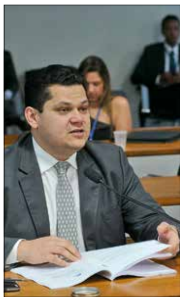
Davi Alcolumbre ressalta que texto se refere a serviços de intermediação

A medida visa padronizar a cobrança de ISS sobre a venda, por exemplo, de pacotes turísticos compostos de bilhete aéreo e hospedagem. Nesses casos, a remuneração da agência de turismo ocorre na forma de comissão paga pela companhia aérea e pelo hotel. No entanto, ao cobrar o ISS, alguns municípios têm considerado como base de cálculo o valor total do pacote turístico, e não apenas a comissão recebida pela venda do pacote. O projeto visa acabar com essa distorção, argumenta o autor, o ex-senador Rodrigo Rollemberg, na justificativa do texto.