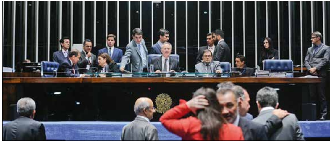
Plenário aprova emenda da Câmara ao projeto do Senado sobre trabalho voluntário. Texto vai para sanção presidencial

O texto aprovado é a Emenda da Câmara dos Deputados (ECD) 4/2015, ao Projeto de Lei do Senado (PLS) 12/2000.