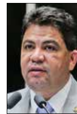
Cidinho Santos/Agência Senado

O programa de reforma agrária deve ser executado pelos municípios, e não pelo governo federal, defendeu Cidinho Santos (PR-MT). Ele sugeriu que o governo discuta a proposta com governadores e prefeitos. O senador disse ainda que apresentou emenda à MP 696/2016, que reestrutura ministérios, para manter a agricultura familiar no Ministério da Agricultura.