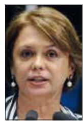
Ângela Portela/Agência Senado

— O governo quer jogar [os custos da reforma] no colo dos que mais precisam. O governo aposta na precarização da condição dos idosos, população que mais cresce, e, ao mesmo tempo, congela as despesas do sistema de saúde. Isso é desumano.