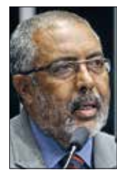
Paulo Paim/Agência Senado

— Se imperar essa tese do negociado sobre o legislado, o que vale é a força de quem tem o poder. O empregado concorda com aquilo que ele quer, abrindo mão de direitos.