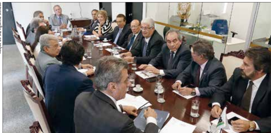
Bancada do PMDB durante reunião em que decidiu indicar Lobão para presidência de comissão

Dos 27 titulares, 25 já foram indicados para compor a CCJ, que vai ser instalada hoje, às 10h. 2