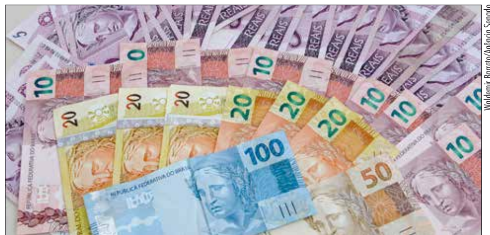
Medida provisória aprovada ontem libera importação de cédulas e moedas em caso de emergência