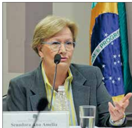
É preciso coibir fraudes, ressalta Ana Amélia

O deputado Bohn Gass (PT-RS) enfatizou a relação do Cartão Reforma com o Minha Casa, Minha Vida, apontando a importância de incentivos governamen-