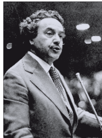
Eleito pelo Rio Grande do Sul, Paulo Brossard era conhecido pela oratória