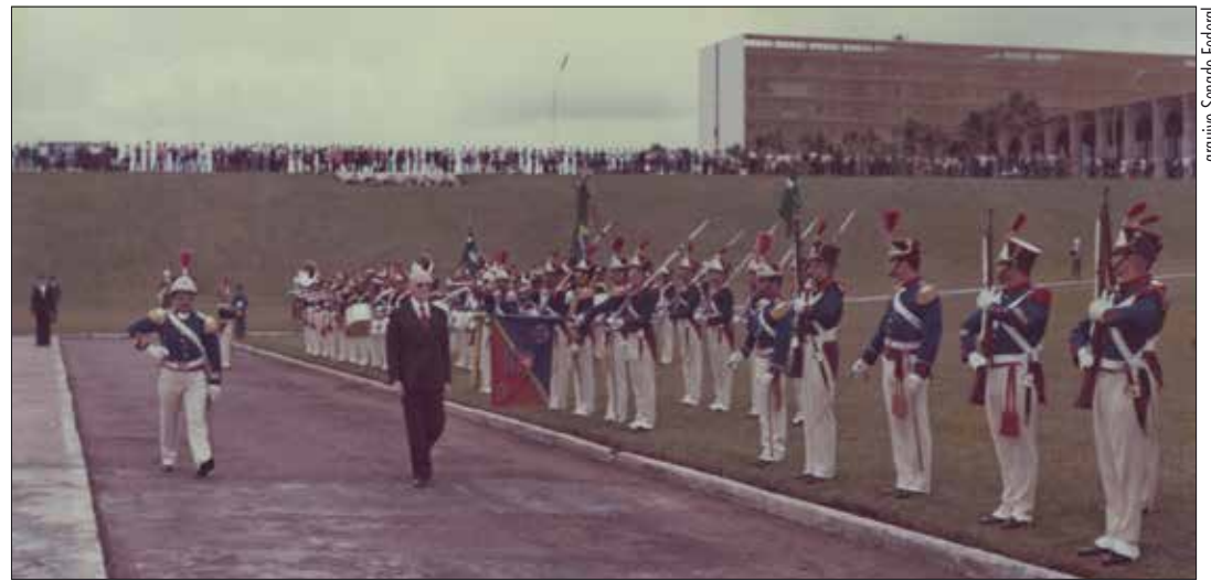
Cerimônia de posse do presidente Geisel em frente ao Congresso, em 1974: três anos depois, ele fecharia o Legislativo

Do ponto de vista político, os resultados das eleições de 1974 sinalizavam que Geisel teria dificuldades no Legislativo. Na Câmara, o MDB ficou