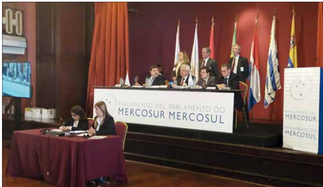
O deputado brasileiro Arlindo Chinaglia (2º à esq.) preside sessão do Parlamento do Mercosul em Montevideu

O presidente do Parlasul, deputado Arlindo Chinaglia (PT-SP), precisou enfrentar, no início da sessão, um desafio político com venezuelanos. Por obediência ao Regimento Interno, ele garantiu a palavra ao deputado chavista Saúl Or-