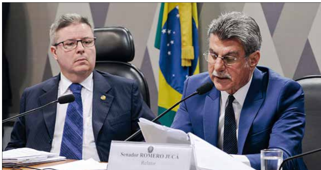
Jucá (D) defende a aprovação do texto na Comissão de Constituição e Justiça, que tem Anastasia como vice-presidente

A CCJ é o terceiro colegiado a analisar a proposta de reforma trabalhista no Senado. Depois o texto será submetido ao Plenário. 3