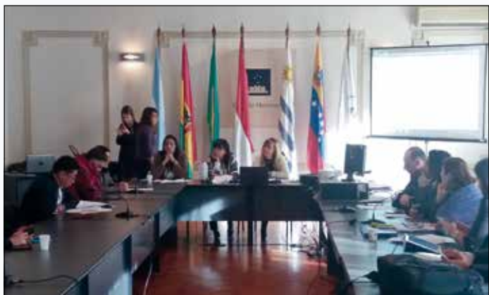
Comissão de Direitos Humanos do Parlasul faz manifesto de solidariedade

— Não tem mocinho nessa história. Mas o Parlasul pode ser uma voz ativa em defesa do entendimento e da negociação — propôs.