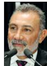
Waldemir Barreto/Agência Senado

— Se o Brasil quer sair do berço esplêndido e ganhar o mundo, é inevitável que a educação básica de qualidade seja a sua prioridade.