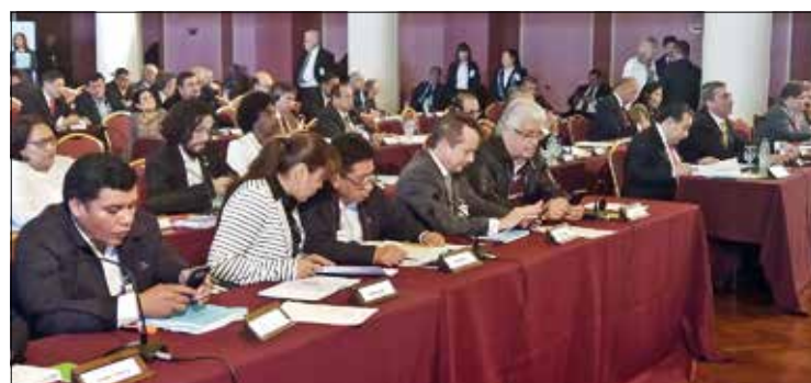
Parlasul discute medidas tomadas por Maduro em resposta à crise política no país

cujo governo é acusado de agredir normas democráticas, foi o principal tema de debates ontem na reunião do Parlasul. 7