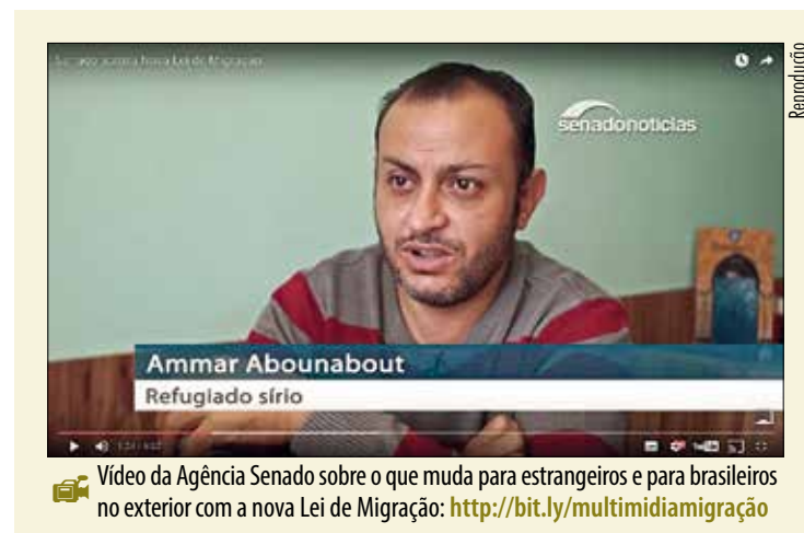
Vídeo da Agência Senado sobre o que muda para estrangeiros e para brasileiros no exterior com a nova Lei de Migração: http://bit.ly/multimidiamigração

TRABALHADORES MARÍTIMOS O Estatuto do Estrangeiro determinava que tripulantes internacionais que trabalham nos navios precisavam pagar taxas consulares ao Ministério do Trabalho. A nova lei acaba com essa exigência, o que reduz custos e simplifica a operação dos cruzeiros. A medida deve, assim, atrair mais cruzeiros e gerar emprego e renda.