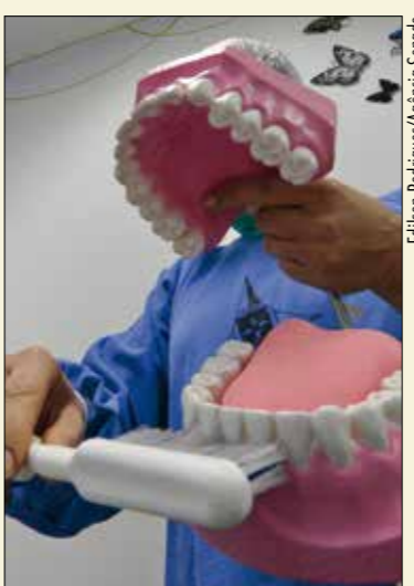
Dentista do SUS ensina paciente a escovar os dentes corretamente

— O setor público não oferecia o tratamento de canal. Quando