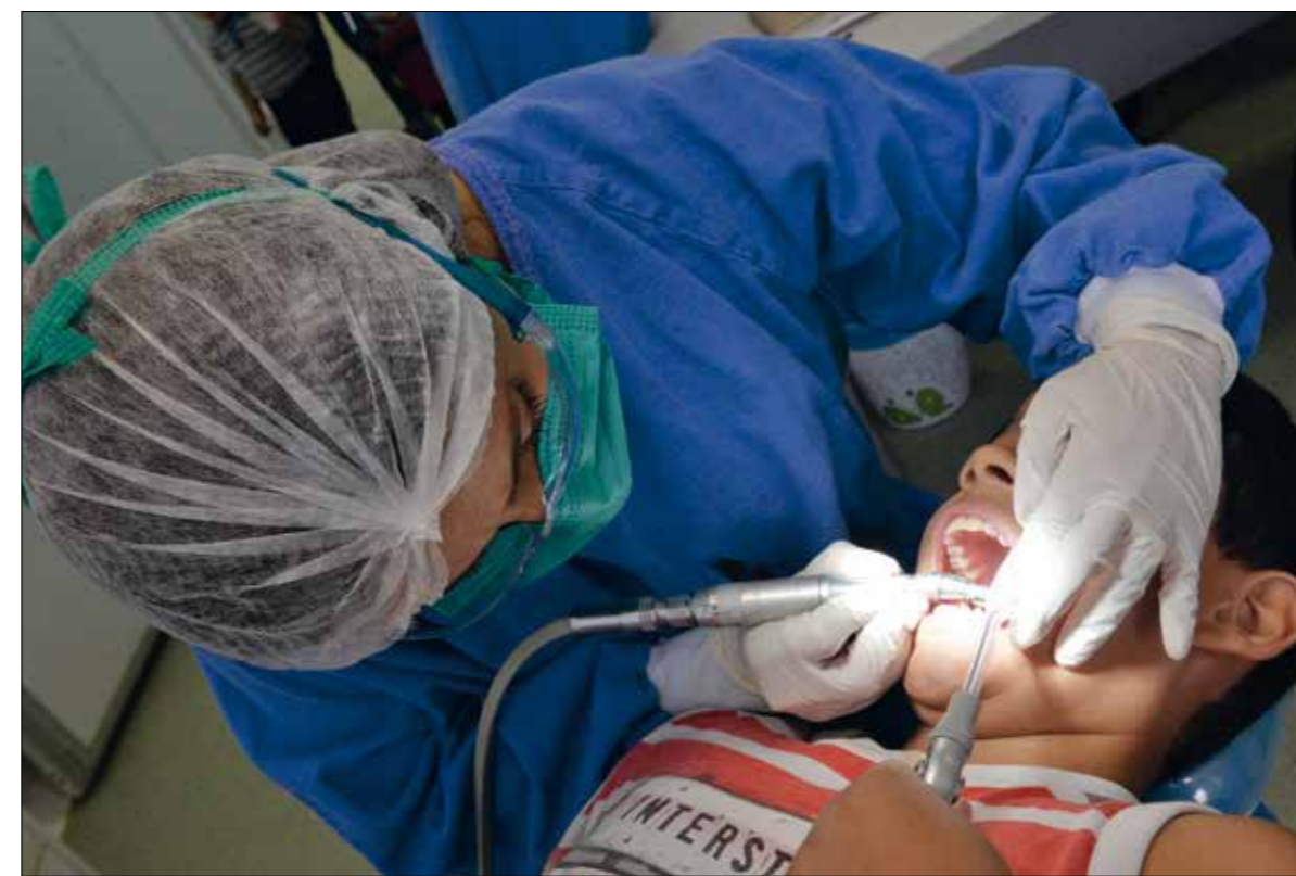
Senadores apresentaram projetos para que prevenção e tratamento de problemas dentários sejam oferecidos pelo SUS

Humberto ressaltou que a iniciativa de transformar o Brasil Sorridente em lei tem o apoio de organizações de odontologistas,