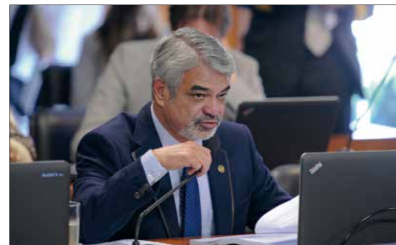
Senador Humberto Costa, ex-ministro da Saúde, quer que Brasil Sorridente vire lei

— Ele vai desde a promoção, passando pela prevenção, até a cura e, em muitos casos, passando também pela rea-