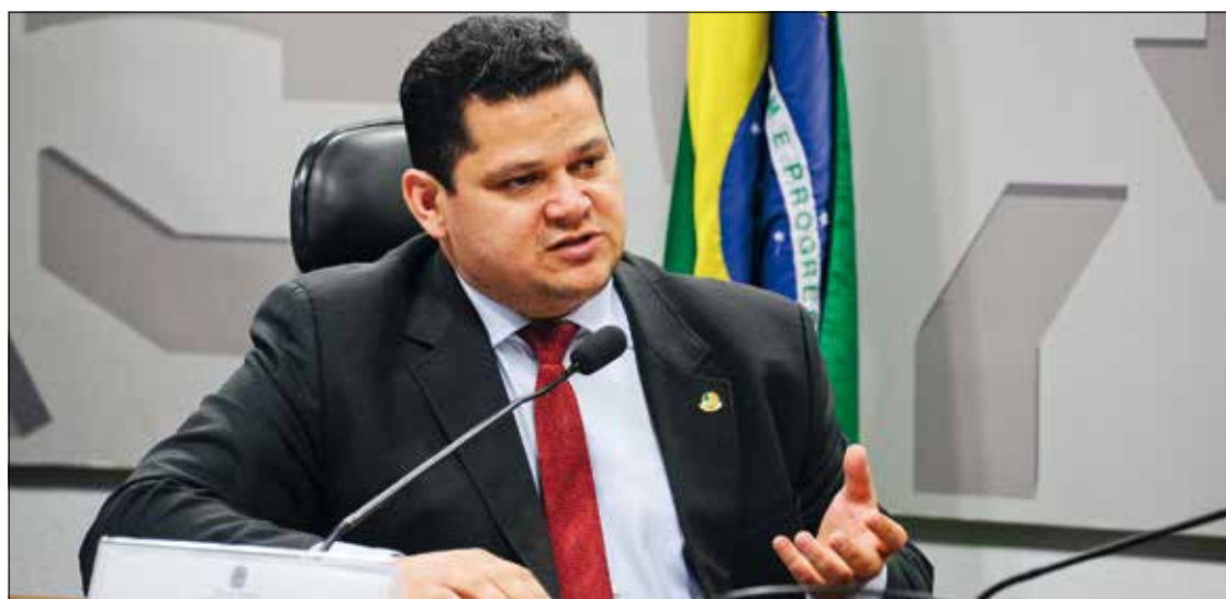
Davi Alcolumbre defende que as cotas sejam adotadas por estados para que possam ser negociadas entre eles

Foram convidados o presidente do Serviço Florestal Brasileiro, Raimundo Deusdará Filho, representando o Ministério do Meio Ambiente; o