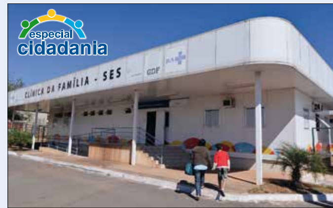
Projeto de lei prevê assistência odontológica obrigatória na rede pública

O relatório de Wilder Moraes sobre a medida provisória que institui o Programa de Regularização de Débitos não Tributários pode ser votado hoje pela comissão que analisa o tema. A MP institui um refinanciamento de débitos, permitindo que pessoas físicas e empresas possam renegociar dívidas com órgãos públicos. 7