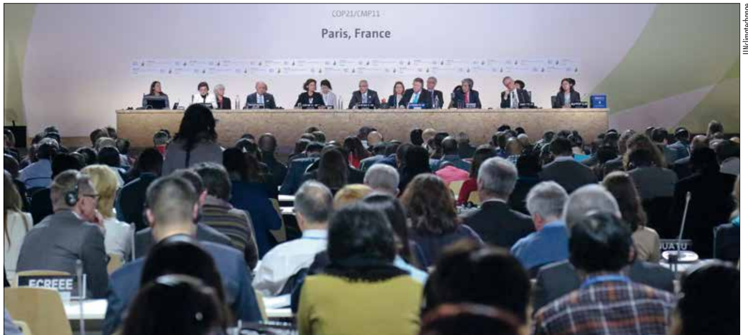
O Acordo de Paris, assinado em 2015, teve a adesão de 195 países, que se comprometeram a implementar medidas para reduzir a mudança do clima

O novo Código Florestal foi aprovado pelo Senado em novembro de 2011 e transformado em lei em maio do ano seguinte, depois de passar pela Câmara dos Deputados. A tramitação do projeto (PLC