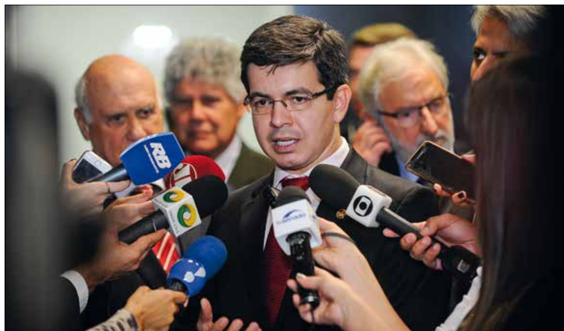
Randolfe diz que pretende ajuizar ação popular na Justiça Federal do Amapá e até recorrer ao Supremo

De acordo com a Agência Brasil, o ministro do Meio Ambiente, Sarney Filho, disse após o anúncio que o novo decreto poderia ser publicado numa edição extra do Diário Oficial da União de ontem. Entre as mudanças citadas pelo