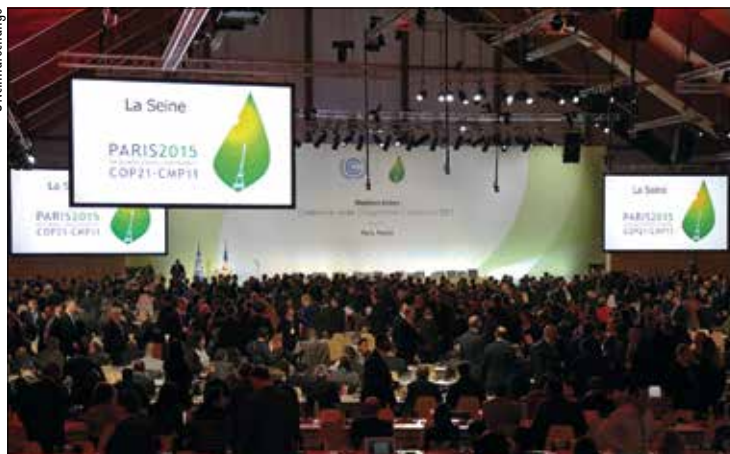
Reunião em Paris aprovou em 2015 o acordo contra as mudanças climáticas