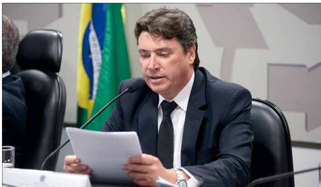
Wilder quer permitir que o devedor converta parte do débito em investimentos priorizados pelo Executivo

Além disso, o relator acatou duas emendas propostas por parlamentares. Uma delas é do deputado Carlos Zarattini (PT-SP), que exclui do Programa de Regularização de Débitos Não Tributários o