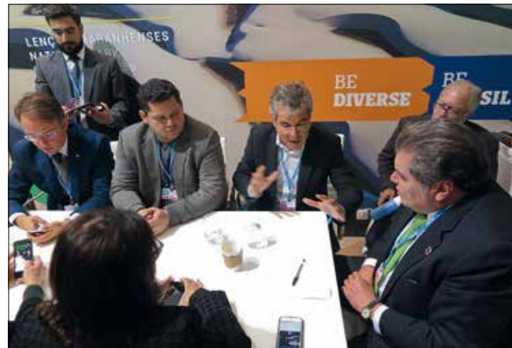
Brasil tem desafios na área ambiental, apontam senadores na COP-23