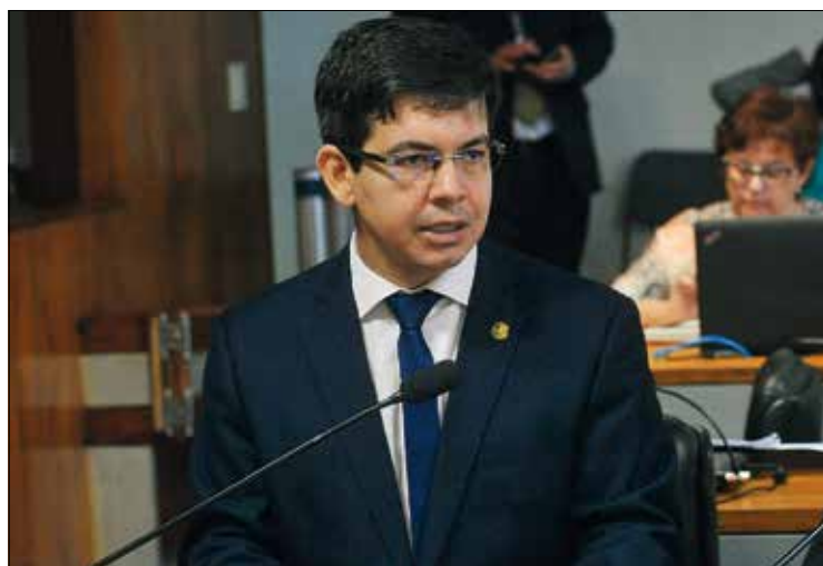
Genardo Magalhães/Agência Senado - 20/9/2017

O CONGRESSO NACIONAL pode discutir, em breve, o fim do auxílio-moradia para deputados, senadores e juizes. Em consulta pública realizada pelo Portal e-Cidadania, a sugestão legislativa é a que tem maior apoio popular — mais de 540 mil votos a favor — e aguarda relatório do senador Randolfe Rodrigues (Rede-AP) na Comissão de Direitos Humanos e Legislação Participativa (CDH).