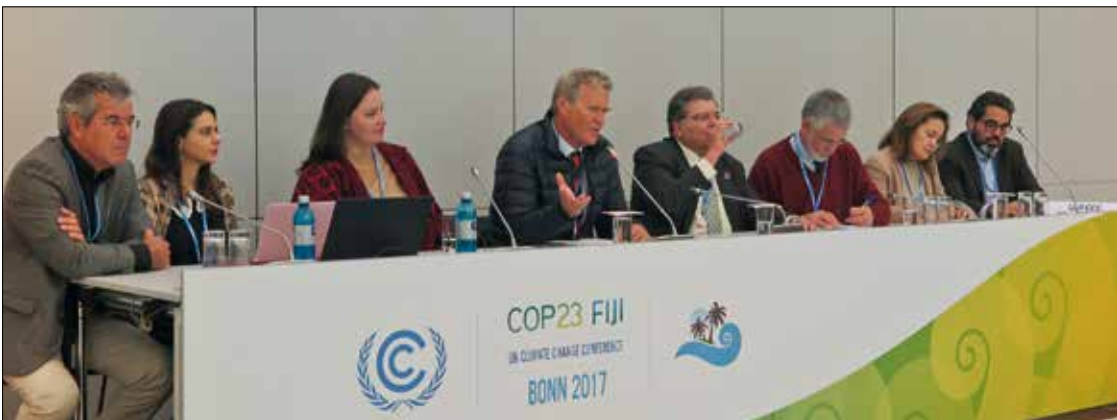
Presidente da Comissão Mista de Mudanças Climáticas, Jorge Viana (1º à esq.) participa de debate na COP-23 em Bonn