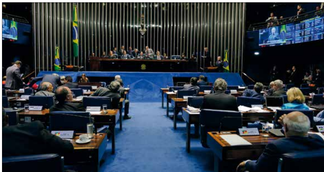
Plenário do Senado também pode decidir sobre limite para alíquota de ICMS para combustível de aviação

A conferência concluiu que consciência ambiental tem avançado no mundo, mas ainda está longe do ideal para o bem comum.