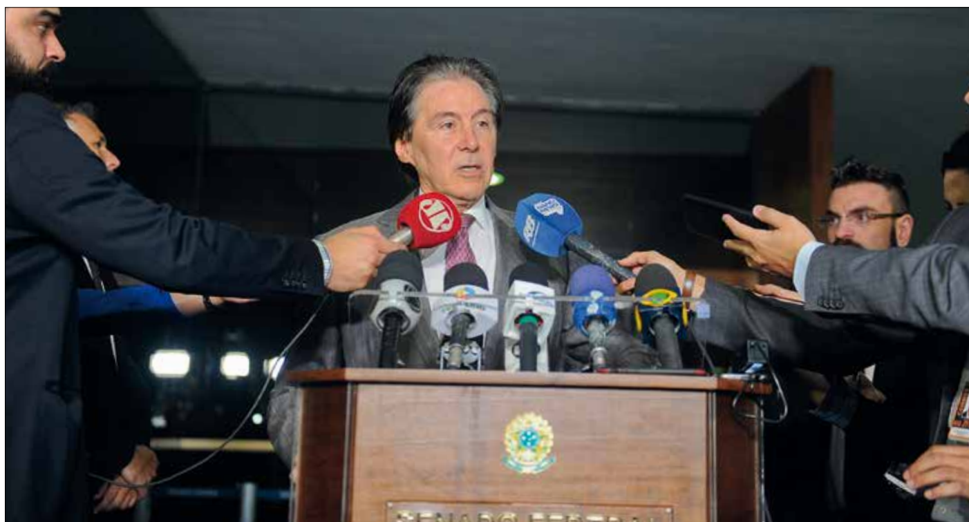
Presidente do Senado, Eunício disse que a MP é importante para concretizar o cumprimento do acordo firmado na votação do projeto

— Seria extremamente deslegante com o Senado que um compromisso feito com o líder do governo, em nome do governo, não se concretizasse.