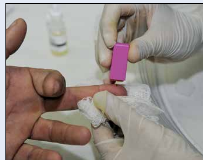
Venilton Kuchler / SESA