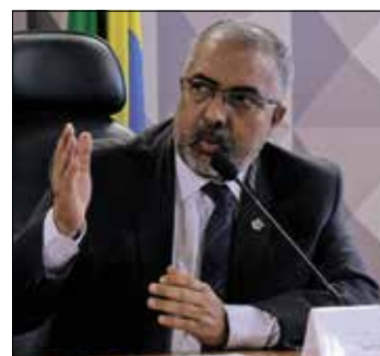
Projeto de Paulo Paim reduz tempo de contribuição para quem tem HIV