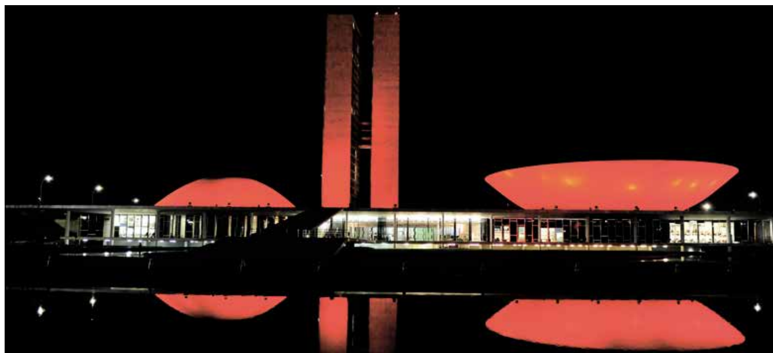
Prédio do Congresso recebe iluminação vermelha em dezembro para marcar a campanha nacional de prevenção a doenças sexualmente transmissíveis, como a aids

— O jovem se esqueceu de que tem de usar preservativo. Nos anos em que se viam mortes de famosos, como o Cazuza, as pessoas se precavam por