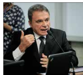
Alvaro quer abater gasto com remédio para aids do Imposto de Renda

programa de subsídio a medicamentos de uso domiciliar, que permite o abatimento parcial dos gastos da base de cálculo do Imposto de Renda. De Alvaro Dias (Pode-PR), a proposta define as doenças alcançadas pela medida e exige perícia médica prévia feita pelo SUS e requerimento à Receita Federal para acesso ao benefício.