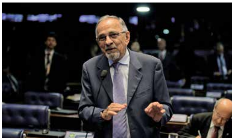
Capiberibe é autor de um dos projetos do pacote de combate à violência

Também está na pauta projeto que institui o Estatuto da Segurança Privada e da Segurança das Instituições Financeiras. O SCD 6/2016 faz