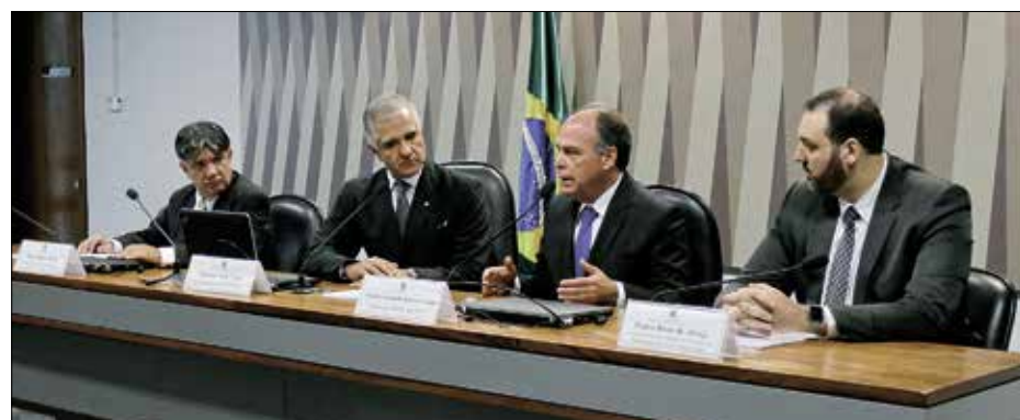
Em audiência, Olavo Bentes, deputado Julio Lopes, senador Fernando Bezerra e Walter Baere

— Não podemos perder a oportunidade de reforçar o crescimento da nossa indústria petroquímica e da nossa indústria de derivados, no sentido de que a gente possa dar sequência a um esforço de ampliação da nossa capacidade de refino.