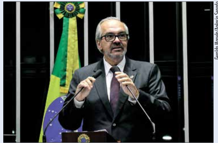
Genildo Magalhães/Agência Senado

O senador citou projetos apresentados por ele