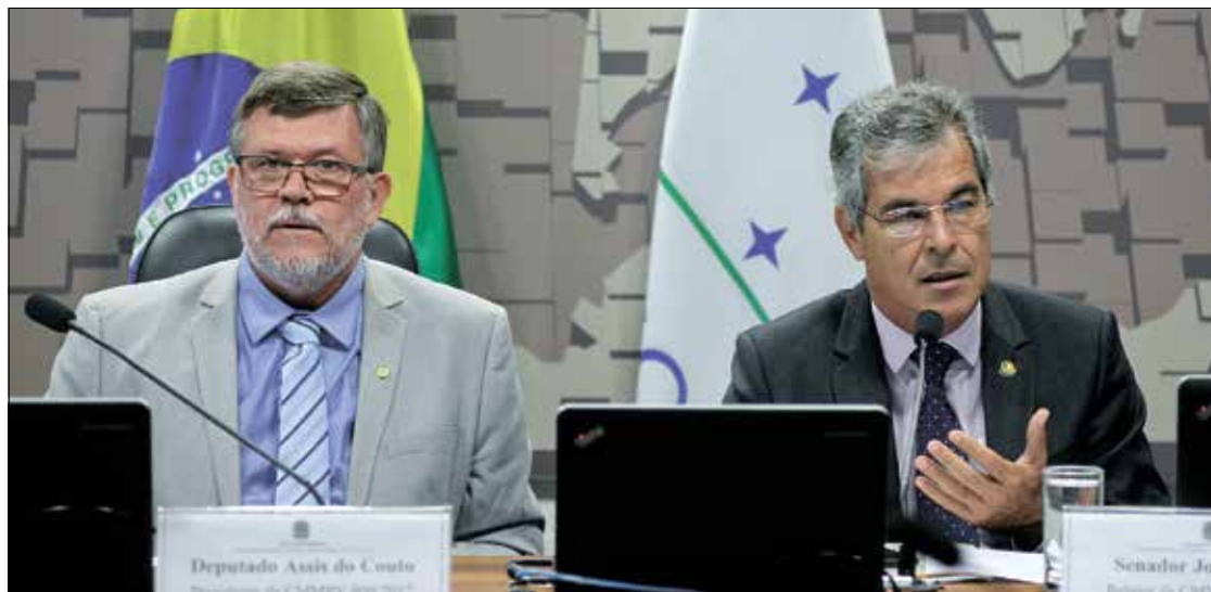
Presidente da comissão, deputado Assis do Couto, e o relator da MP, senador Jorge Viana, na reunião de ontem

é uma espécie de indenização pelo desmatamento, paga pelos responsáveis por obras com significativo impacto ambiental, como a construção de grandes fábricas ou hidrelétricas. O valor inicial do fundo deverá ser de mais de R$ 1 bilhão.