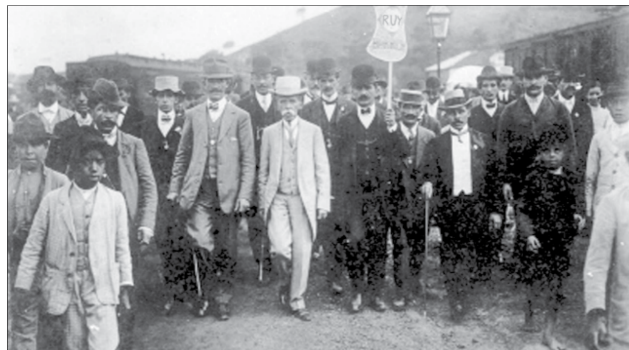
O presidencial Ruy Barbosa (de terno claro) participa de passeata na cidade mineira de Queluz (atual Conselheiro Lafaiete)

Em 1909, contudo, as oligarquias estaduais se estranharam, e a Política dos Governadores sofreu um abalo. Minas Gerais e Rio Grande do Sul escolheram para presidente o ministro da Guerra, marechal Hermes da Fonseca. São Paulo recusou-se a encampar a candidatura.