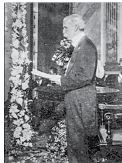
Adversário de Hermes da Fonseca, Ruy discursando num teatro em Belo Horizonte