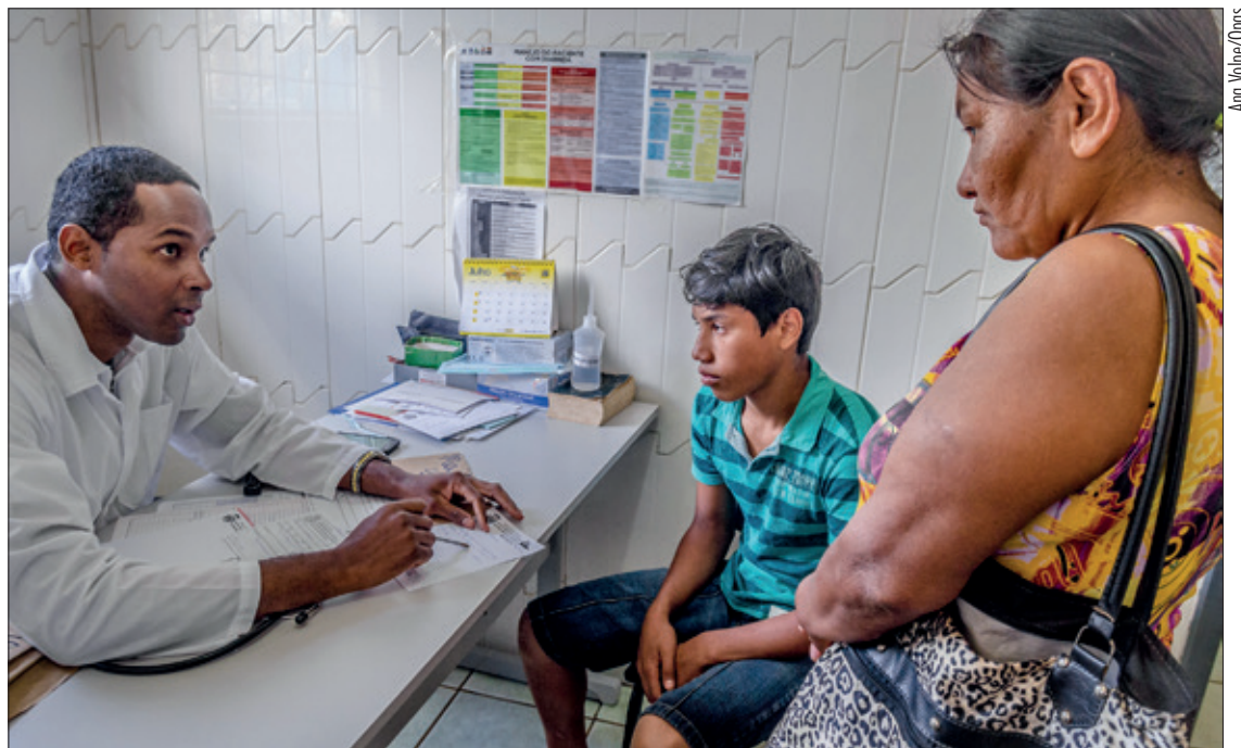
O programa foi criado para suprir a demanda por médicos em locais como periferias de cidades e comunidades isoladas

As inscrições foram finalizadas no domingo. Na quinta e na sexta-feira os médicos brasileiros com registro em conselhos regionais de medicina (CRMs) terão nova chance de participar do programa para preencher vagas de desistentes. Quem não tiver registro poderá pleitear as vagas nos dias 27 e 28. Em seguida, nos dias 3 e 4 de janeiro, as oportunidades serão abertas