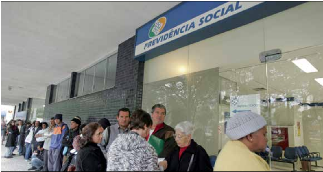
Agência do INSS em Curitiba: governo pretende economizar perto de R$ 1 trilhão com as novas regras