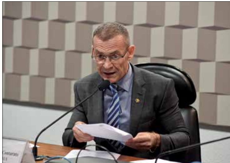
Para Contarato, egressos de escola pública não concorrem em igualdade

O projeto aguardava o recebimento de emendas até sexta-feira. Se for aprovada na CCJ, a proposta segue direto para a Câmara — a não ser que haja um recurso assinado por pelo menos nove senadores para a votação do texto no Plenário da Casa.