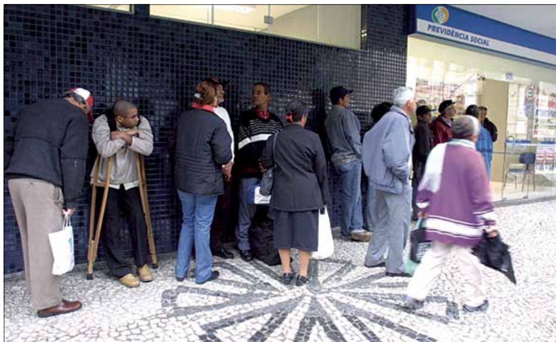
Fila em agência do INSS no Paraná: contas negativas da Previdência impactam dívida pública do país como um todo

— A despesa tem que ser paga, seja com contribuições previdenciárias, seja com contribuições sociais ou impostos. Ao crescer, ela comprime políticas públicas já subfinanciadas, como o saneamento, a educação, a infraestrutura. O déficit é uma medida desse desequilíbrio: a quantidade de recursos de outras áreas, ou de impostos, que será drenada para pagar