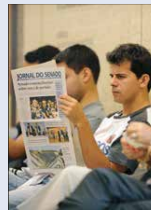
Jornal do Senado é distribuído no aeroporto de Brasília

O trabalho legislativo dos senadores ganhou cobertura diferenciada a partir de 4 de maio de 1995, com a criação do Jornal do Senado . Já são mais de 5 mil edições, cerca de 200 por ano, que dão transparência a debates, votações, CPIs e decisões do Parlamento. De lá para cá, outros produtos foram lançados, como o Especial Cidadania , a versão mensal em braille e a newsletter , que pode ser assinada em senado.leg.br/jornal/newsletterjornal .