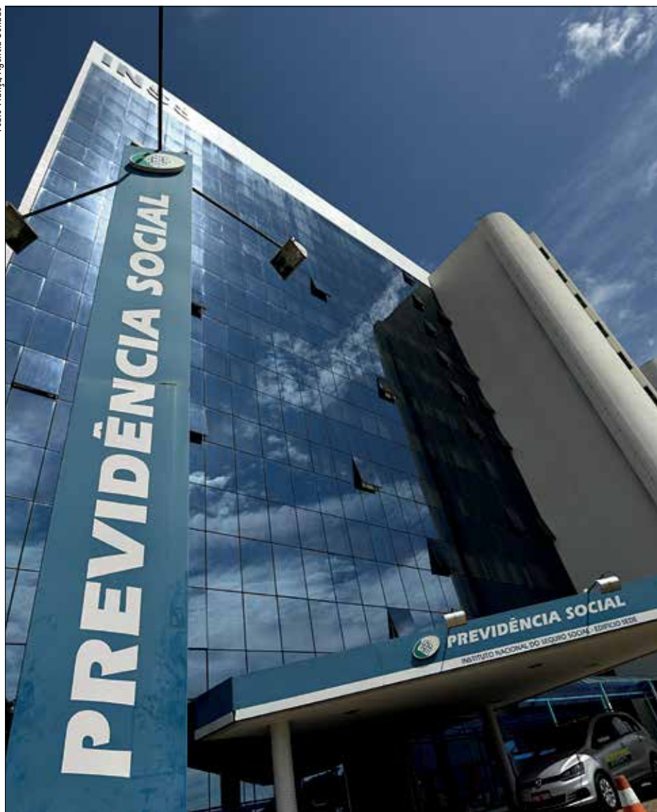
Crescimento da população idosa vem aumentando o percentual do Orçamento gasto com a Previdência