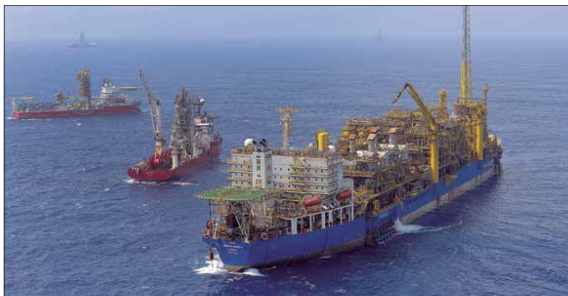
Campo petrolífero na Bacia de Santos: pelo texto, Petrobras pode vender até 70% dos direitos de explorar área

Outro item que pode ser analisado é o projeto de lei do Senado que muda a forma como municípios, estados e Distrito Federal devem calcular as despesas com pessoal (PLS 334/2017). A Lei de Responsabilidade Fiscal (LRF) prevê que esses gastos devem corresponder a 60% da receita corrente líquida (RCL) de cada ente.