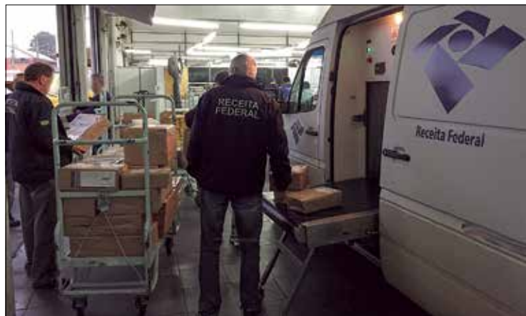
Servidores da Receita estão entre os que tiveram reajuste adiado pela MP

Na mensagem enviada ao Congresso, o ministro do Planejamento, Esteves Pedro