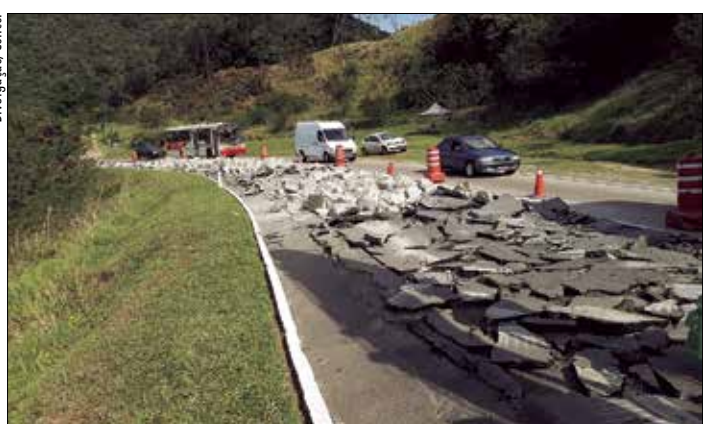
Trecho da BR-040 em Petrópolis (RJ) é uma das obras analisadas pelo TCU