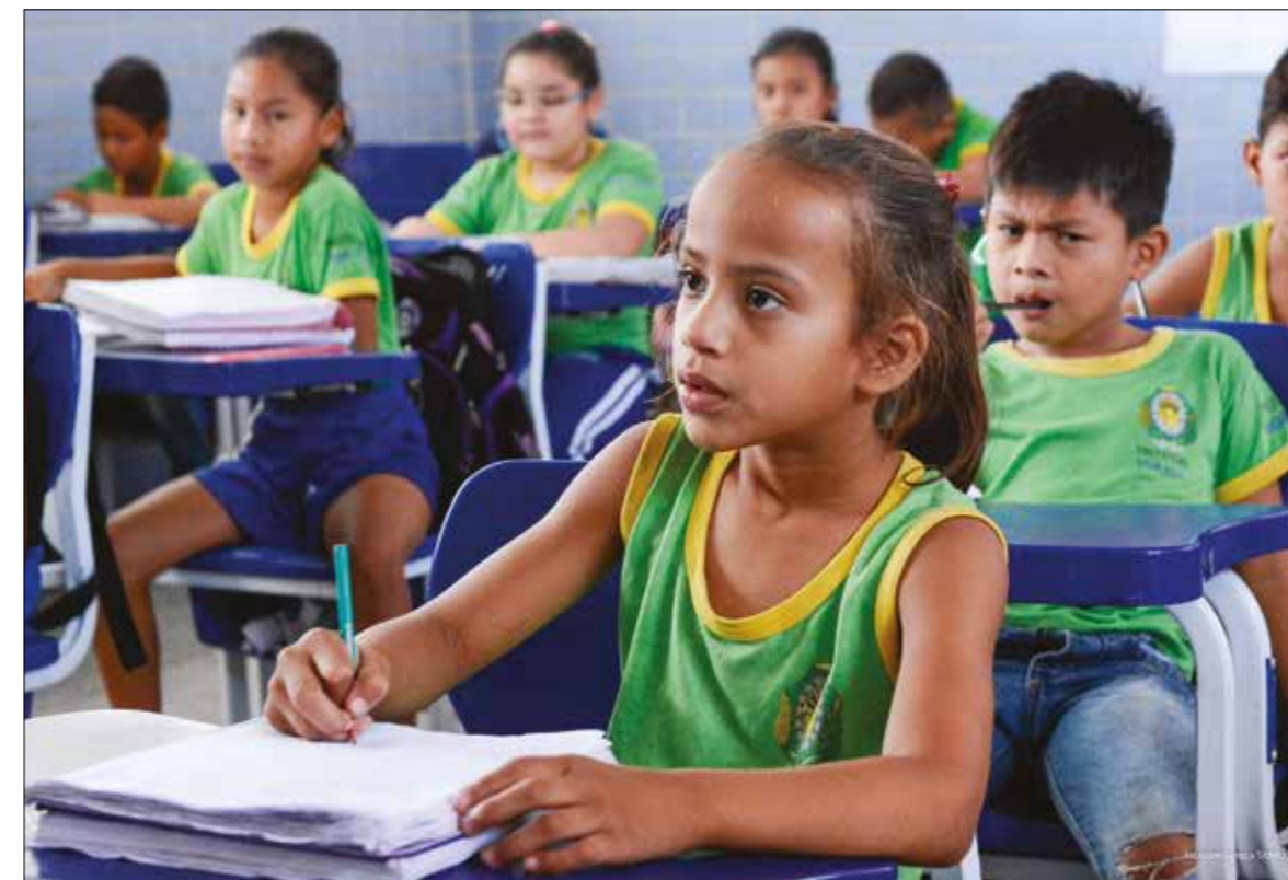
Alunos de colégio municipal de Boa Vista: Fundeb destina dinheiro para todas as redes de ensino estaduais e municipais

Rebatizado como Fundeb, o fundo deixou de financiar apenas o ensino fundamental e passou a cobrir toda a educação básica. No entanto, permane-