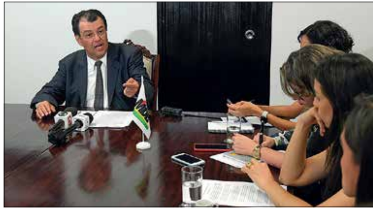
Eduardo Braga destaca que texto é fruto do entendimento entre líderes

Segundo Braga, o projeto estabelece critérios para aposentadoria especial com base na atividade e não com base na categoria do trabalhador. O senador afirmou ainda que o projeto não vai afrouxar regras ou retirar direitos, mas criar