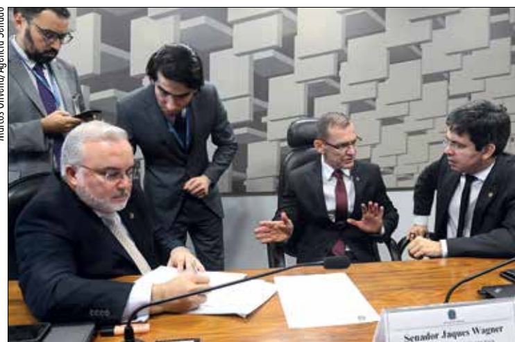
Jean Paul, relator, Contarato, presidente da CMA, e Randolfe fazem parte

Também compõem a comissão Humberto Costa (PT-PE), Styvenson Valentim (Podemos-RN), Jaques Wagner (PT-BA), Fernando Bezerra Coelho (MDB-PE), Rodrigo Cunha (PSDB-AL) e Daniella Ribeiro (PP-PB).