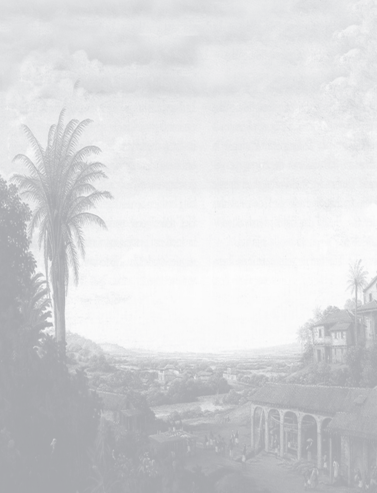
Engenho de açúcar no período do Brasil Colônia, óleo do neerlandês Frans Janszoon Post (*Leyden, 1612 – †Haarlem17/2/1680)