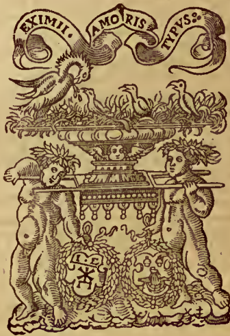
Ce volume a 4 ff. prélim., cxxi pp. de texte, plus un f. pour le privilège et pour cette autre marque des

Le titre porte la marque des Marnef que nous donnons ici :