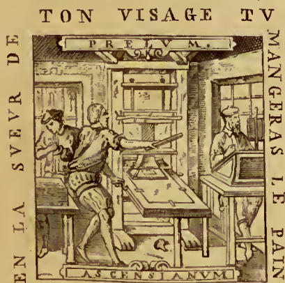
Alcozer (P. de). Hist. de Toledo, 26127 Alcock (Th.). Travels, 19991.