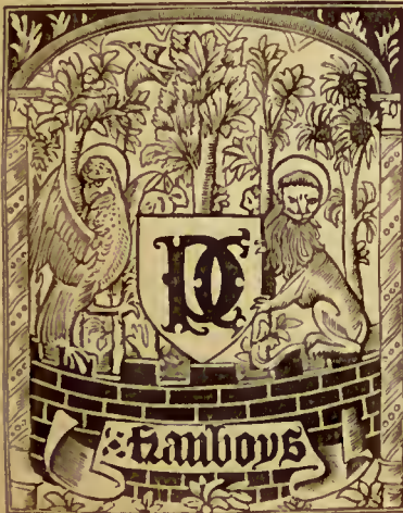
Le nom de Sicille ne paraît aucunement ici.

Au-dessous du titre et au verso les armes de France avec le collier de l'ordre de Saint-Michel. A la suite de la souscription, au verso du dernier f., la marque que nous donnons ici réduite :