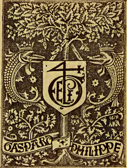
FAUSTUS de captivitate Ludovici Sphoricie. Parisiis, Johannes Petit, 1506, die 26 maii , in-4, de 10 ff. en lettres rondes, sign. a-b.

Le frontispice porte la marque que nous donnons ci-dessous. Gaspard Philippe imprimait à Paris de 1500 à 1510.