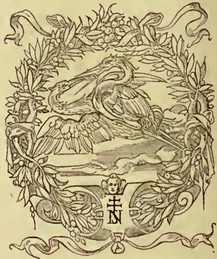
Perlin ( Ch. ). De la Richesse , 4038.

Perleaud aîné ( M.-A. ). Demostheniana , 18528. — Ciceroniana , 18528. — Sur l'histoire de Lyon , 24600. — Bibliographie lyonnaise , 31242.