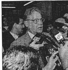
FH na saída do oculista