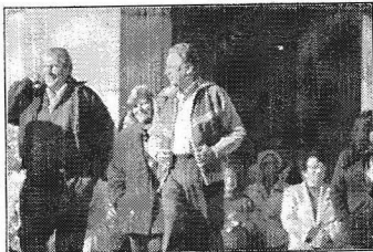
Covas e FH em frente ao Palácio Boa Vista

Ambos disseram não ter discutido assuntos políticos. No final da tarde, Fernando Henrique foi para São Paulo encontrar-se com sua mulher, Ruth.