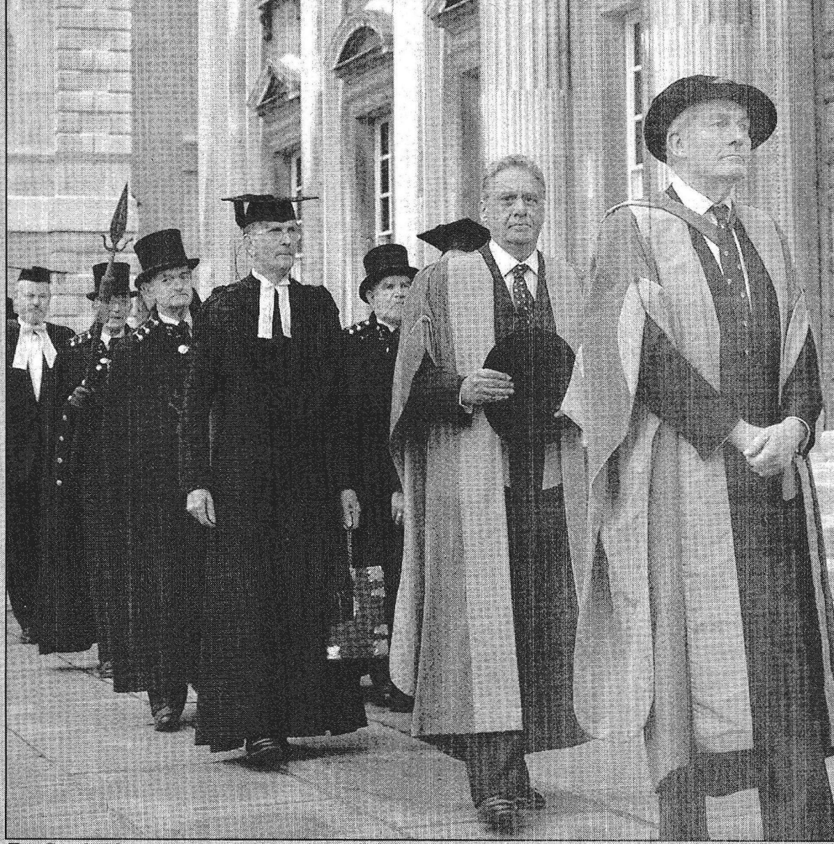
Em Cambridge, para receber mais um título de doutor honoris causa: "Nunca contei quantos"