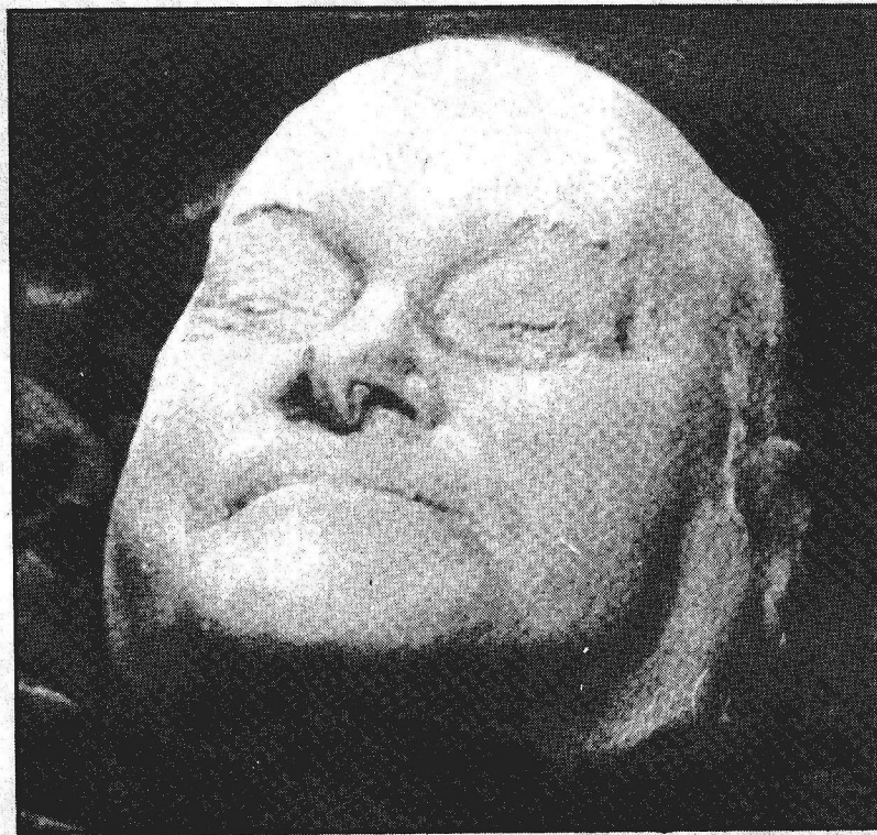
Na máscara mortuária, a prova de que o Presidente morreu com a expressão tranquila