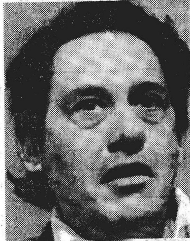
Cardoso, em 1978: 1ª eleição

ral quanto à validade da candidatura pelo fato de Cardoso ter sido aposentado como professor da USP, em 69, com base no AI-5, e, em consequência, ter tido a elegibilidade suspensa por 10 anos. O STF manteve a candidatura por oito votos contra um. A derrota para Montoro, quatro anos depois, se transformou em vitória. Em 82, Montoro disputou — com sucesso — o governo paulista, abrindo caminho para Cardoso, suplente de senador graças à sublegenda prevista no Pacote de Abril de 77.