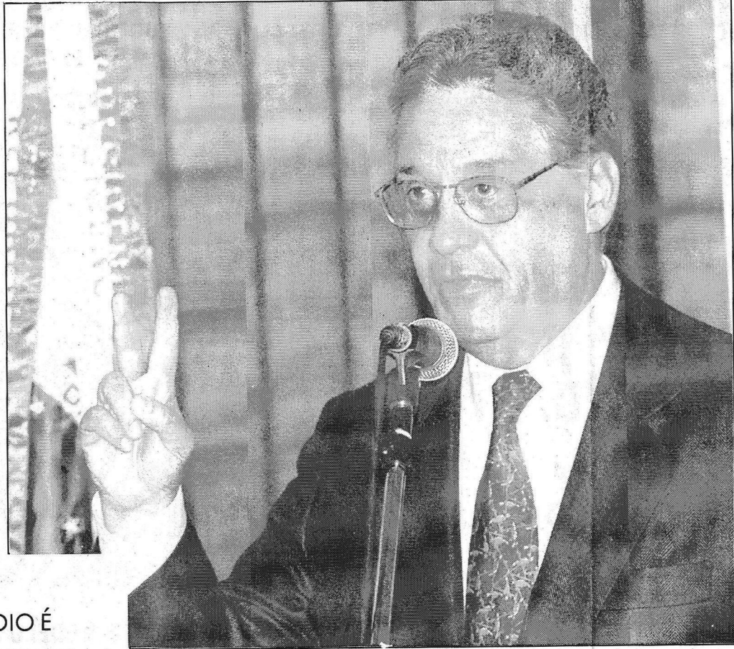
Fernando Henrique: escândalo da compra de votos não abalou imagem