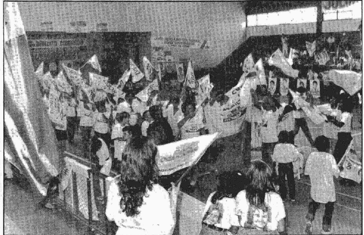
A convenção do PTR, em Taguatinga, começou bem animada de manhã e durou todo o dia