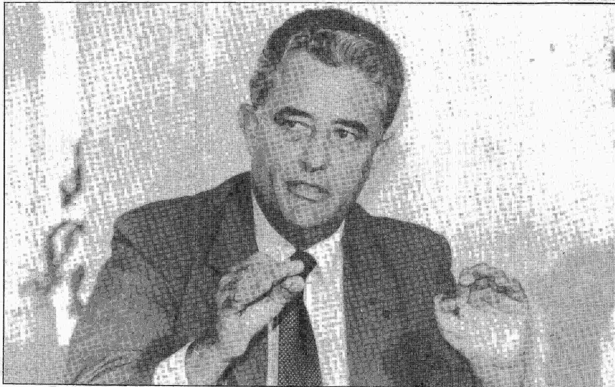
Roriz vai assistir à gravação do debate para analisar o desempenho dos concorrentes