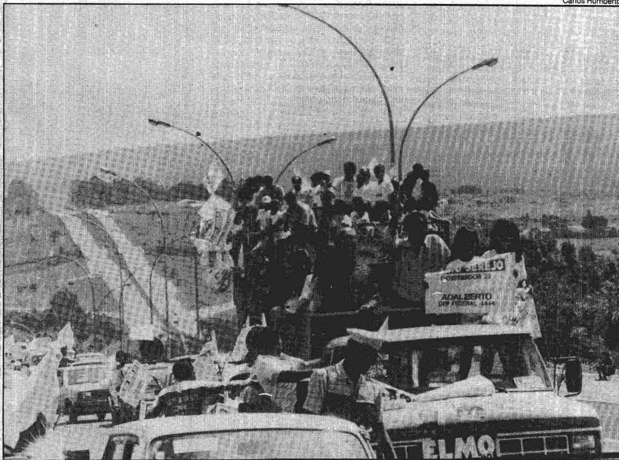
Os dois candidatos percorreram o Plano Piloto por mais de três horas, ontem de manhã