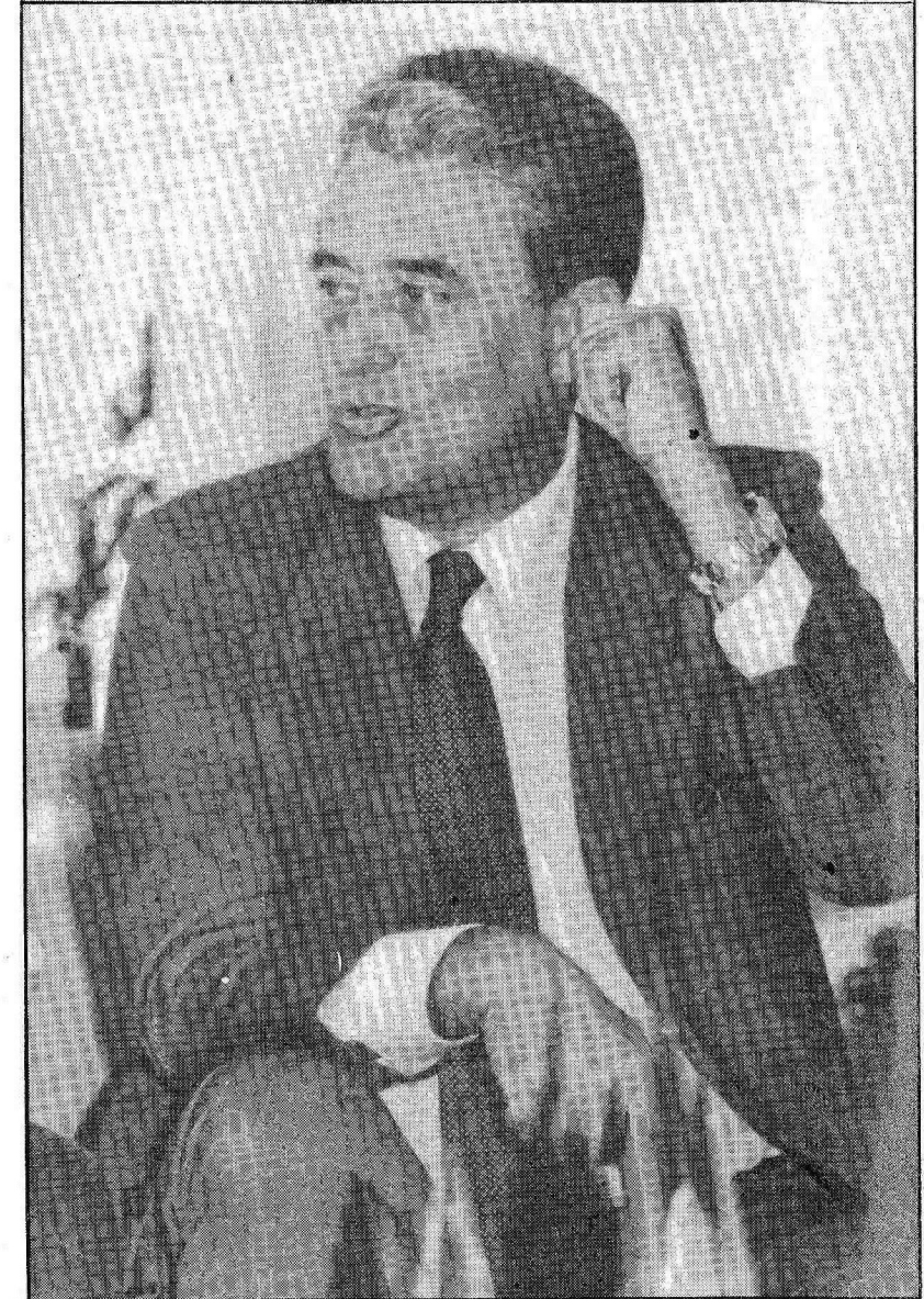
A previsão do diretor da MSC é de que Roriz ganha no 1º turno