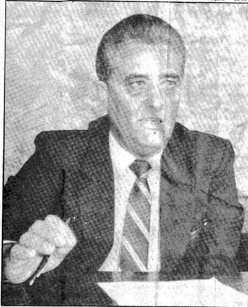
Roriz terá filha de ex-governador na TV para desmentir Elmo