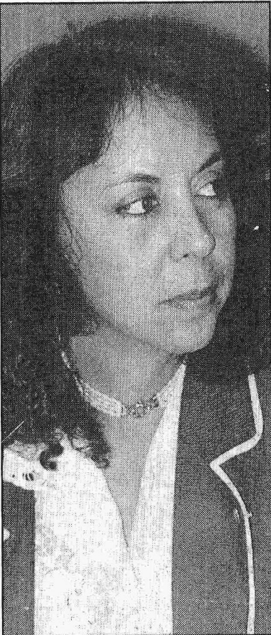
Abadia: chance de encostar