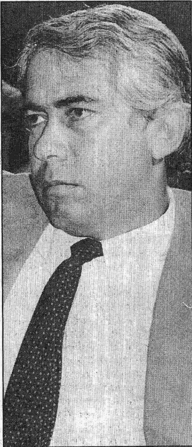
Sigmaringa: adversário mais fraco