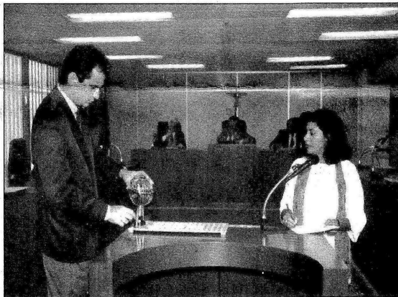
O sorteio realizado ontem no TRE definiu a ordem dos candidatos na cédula