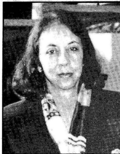
Tucana é egocêntrica

agradá-la. "Existe uma curva crescente se insinuando, mas não para agora. Nesse momento, sua situação é estável, mas turbulências