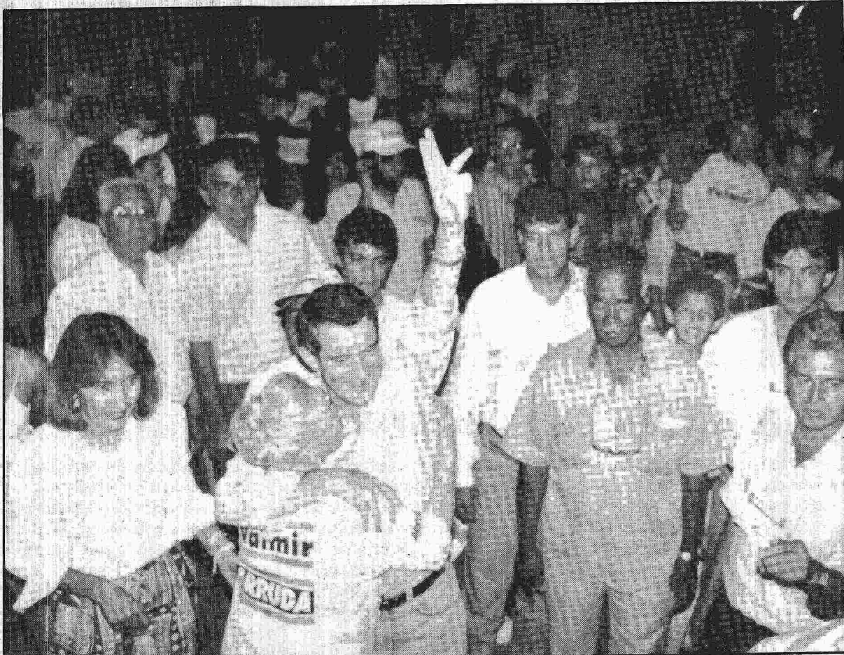
O candidato ao Governo do DF encerrou sua campanha pedindo votos no meio dos eleitores