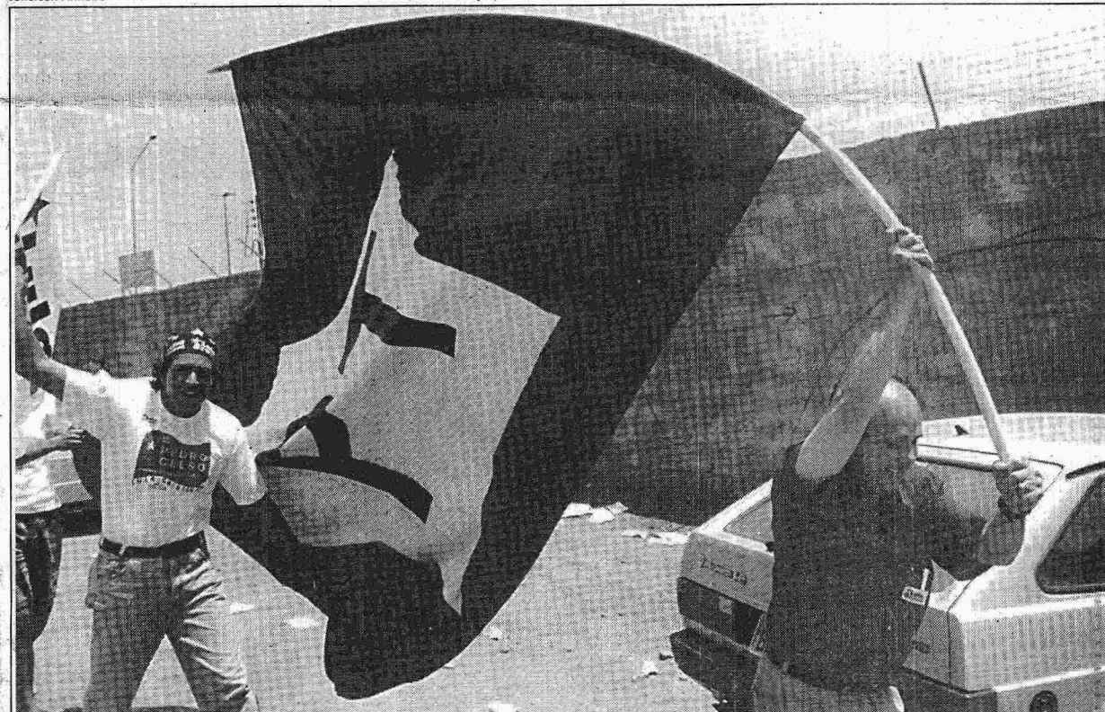
Cristovam Buarque, certo de ir ao 2º turno, após votar no Colégio Alvorada foi conferir o trabalho dos mili-

“Sei que não vou me arrepender, tanto pelo pai quanto pelo can-