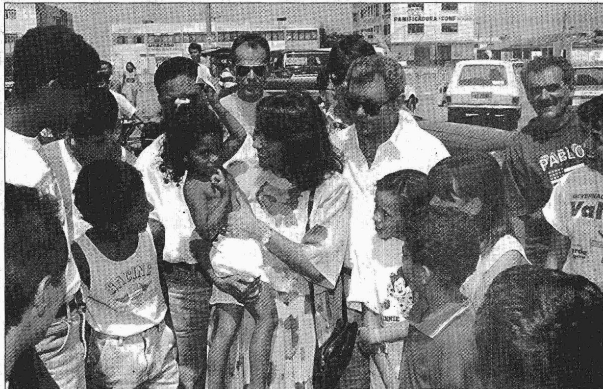
Abadia votou confiante na possibilidade de disputar o 2º turno, apesar de estar em terceiro nas pesquisas

Abastecimento — Ao deixar o apartamento, parou no posto de gasolina da sua quadra para abas-