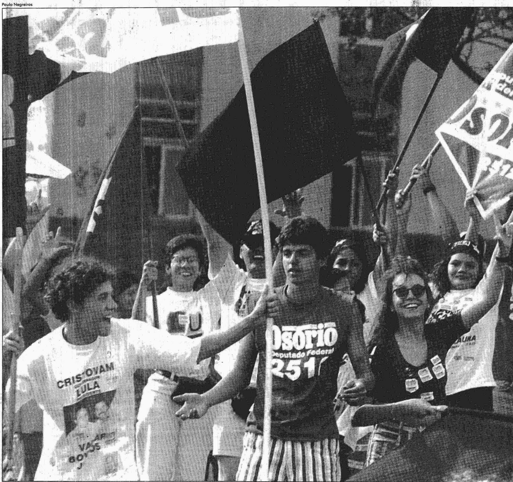
O PT pôs a militância nas ruas e trabalhou duro durante todo o dia. Mas não conseguiu virar o jogo e fazer com que Lula fosse para o segundo turno