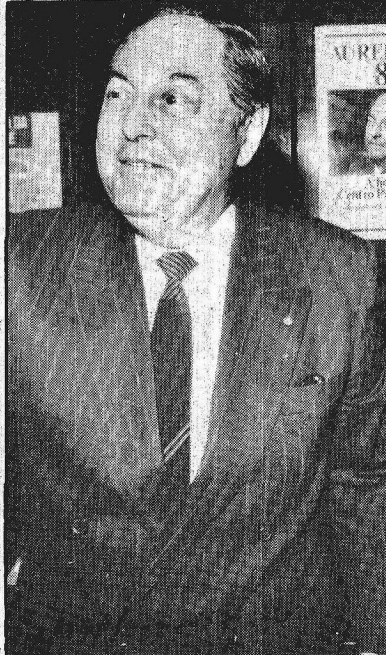
O benefício atinge o presidenciaél Brizola, o presidente Sarney e o ex-vice Aureliano