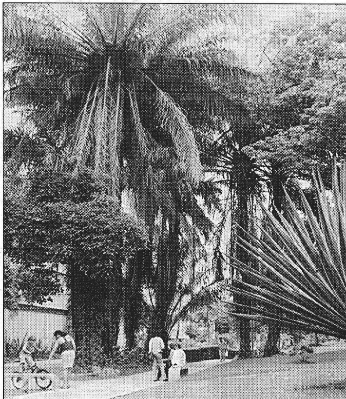
Em toda a quadra, espaço verde chama a atenção