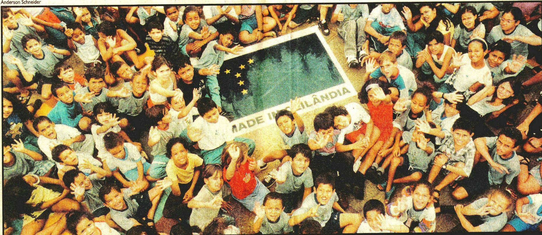
A revista dá um panorama de todas as cidades do Distrito Federal, como Ceilândia, que se destaca pela produção voltada à exportação