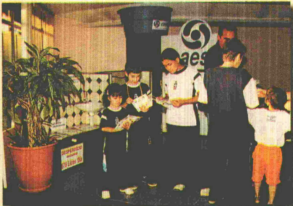
Trabalho junto à comunidade mostra o que a Caesb vem fazendo